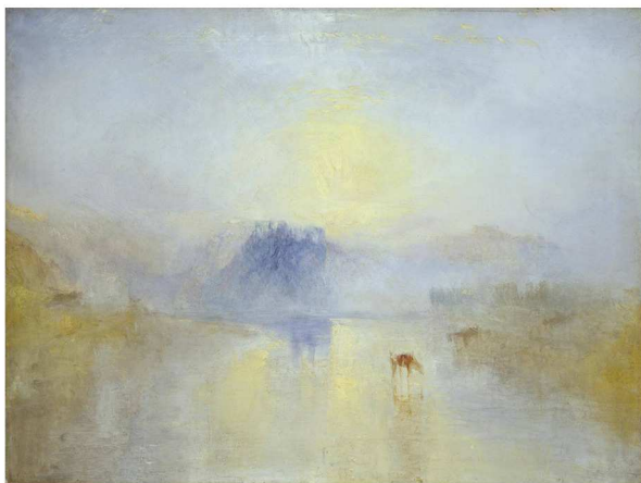
4. kép: William Turner: Norham Castle, Sunrise

(1845, 90,8 x 121,9 cm, olaj, vászon, London: Tate Britain)