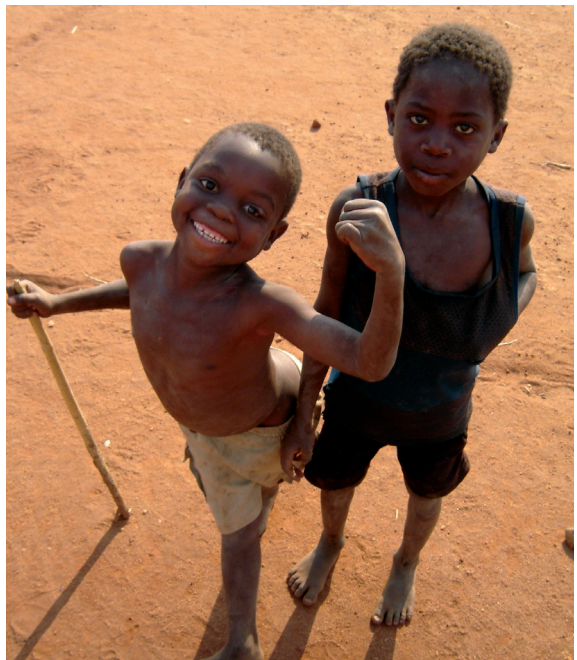
A jövő reményeségei

A fejlesztési segélyek elméletben komoly eredményeket produkálnak mind az élelmiszer-termelés, mind az egészségügy, illetve a szegénység csökkentése területén. A gyakorlat ellenben sokkal negatívabb képet mutat. A Világbank és az Egyesült Államok által nyújtott segélyek, hitelek feltételei az érintett országban való piacnyitás, a privatizáció, gyakran az adómentesség. A kényszer-privatizáció jó példája Etiópia helyzete. Az ország agropotenciálja kiemelkedő, ennek ellenére az emberek többsége szegény és éheznek. A mezőgazdasági területek jelentős hányadát a kávéültetvények foglalják el, kiszorítva ezzel az élelmiszer-növényeket. A kávé piaci árát az érdekelt nagyvállalatok 10 határozzák meg, és mesterségesen tartják alacsonyan. A vállalatok termékeit Nyugat-Európában értékesítik, tehát a fogyasztók közvetlenül támogatják Etiópia kizsákmányolását és a tarthatatlan élelmiszeri helyzetet.