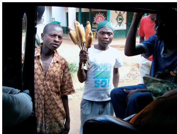
Malawi legfontosabb élelmiszernövénye a kukorica

annak ellenére, hogy a Világbank és az USA sorozatosan támadta őt az intézkedés „piactorzító” hatásaira hivatkozva. Ez az érvelés csak azért érdekes, mert az Egyesült Államok hatalmas összegekkel támogatja a saját mezőgazdaságát.