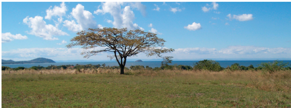
A színek harmóniája • Tájkép Malawiból Salima közelében