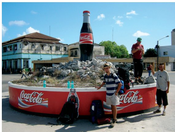
A globalizáció hatása a mozambiki Beirában