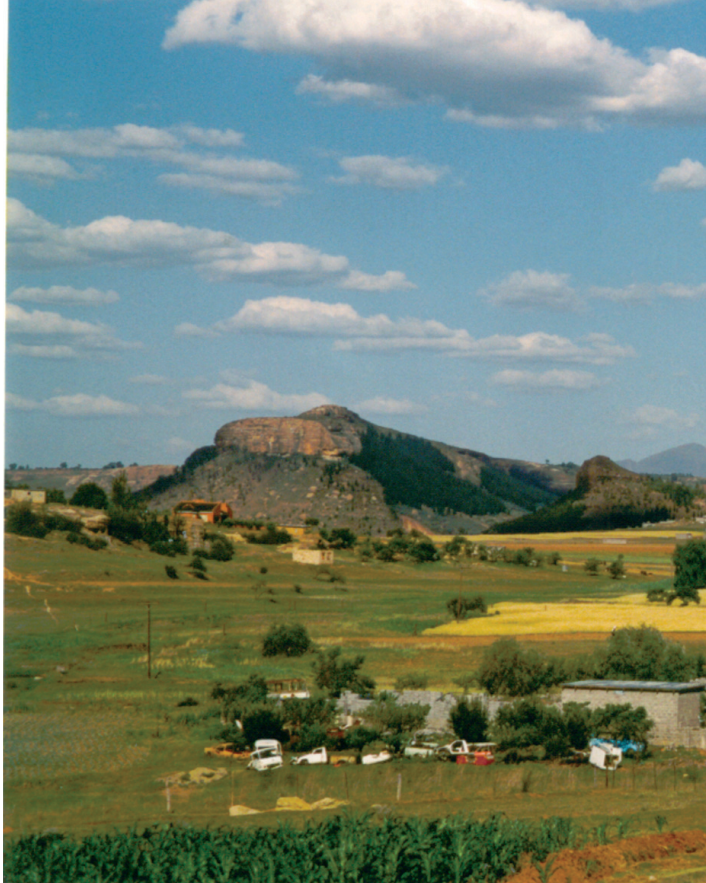
Kis település az út mentén

Az ország nagy reményeket fűz az északkeleti régióban nemrégiben felfedezett gyémántlelőhelyek feltárásához, ám jelenleg egyetlen valós és hosszú távú fejlődési esélye a végtelen mennyiségben rendelkezésre álló víz, a baszutok „fehér aranya”, illetve a vízenergia hasznosítása (a Dél-afrikai Köztársasággal közösen létrehozott Lesotho Highlands Water Project). A dél-afrikai Pretoria-Witwatersrand-Vereening háromszög alkotta ipari régió számára Lesotho vize életbevágó, az enklávét pedig nem csak