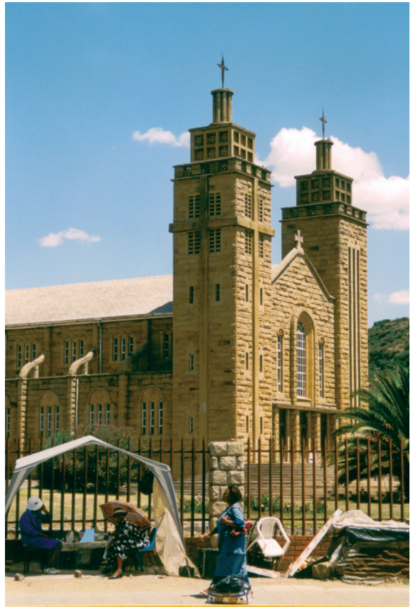
A maserui katedrális

Ennek eredményeként az ország Baszutó föld néven brit protektorátus lett és 1871 és 1884 között Fokföldhöz tartozott, csak ezután vált különálló brit protektorátussá. A brit kormány 1958-ban adott alkotmányt az országnak, az első parlamenti választásokat 1960-ban tartották. Lesotho 1965-ben belső önkormányzatot és új alkotmányt kapott, majd 1966. október 4-