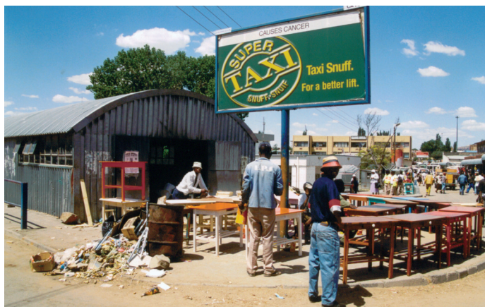
Asztalosok a maserui piacon

Lesothot hivatalosan a világ legszegényebb országai (LDC státusz) között tartják számon, de a szegénység fogalma máshogy jelenik meg az országban, mint másutt a kontinensen. Nem találkozzunk azzal, mely máshol Afrikában megszokott: az éhínség, a nélkülözés egyáltalán nem olyan mértékű, mint néhány afrikai országban. Van elegendő élelmiszer, vannak bevásárlóköz-