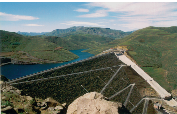
A Mohale vízerőmű

(LCD) nevű szervezet kezére játszotta a végrehajtó hatalmat, a nyílt visszaélések nyomán az új kormány azonban nem kaphatott nemzetközi elismerést.