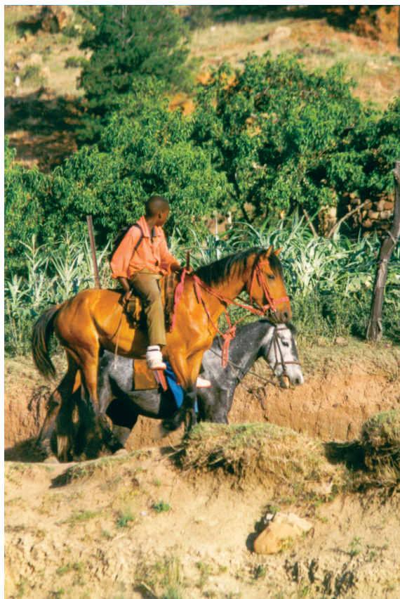
A póni hátán