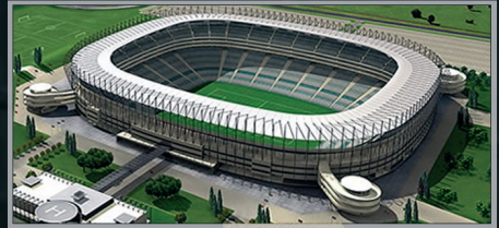
Johannesburg, Soccer City