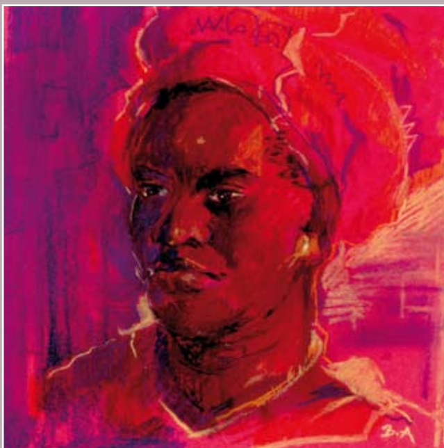
Nigériai nő portréja