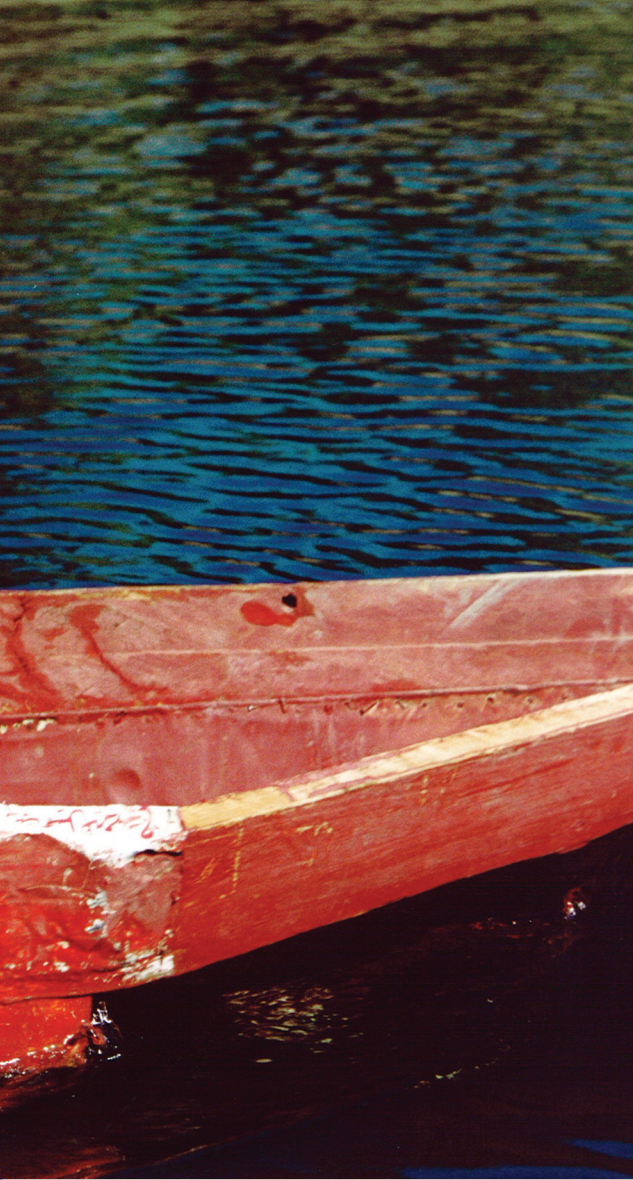
◀ Csónakázó kishű a Niluson

lése, hatásosabb energiapolitika kialakítása. A jövő kulcsa valószínűsíthetően a két nagysúlyú állam, Szudán és Egyiptom érdekeinek összehangolása, hiszen a felek közül minden szempont szerint e két ország az NBI politikájának igazi formálója. A Világbank, az ENSZ Fejlesztési Programja és CIDA, egyetértésben az NBI elveivel, 2001-ben pénzalapot 6 hozott létre a Kezdeményezés támogatására. Az ENSZ saját Környezetvédelmi Programjának keretein belül 1998 óta szintén aktívan részt vesz a nilusi problémák megoldásában. 7