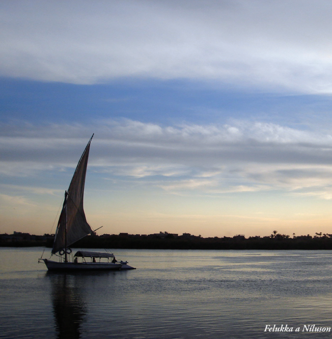
Felukka a Níluson