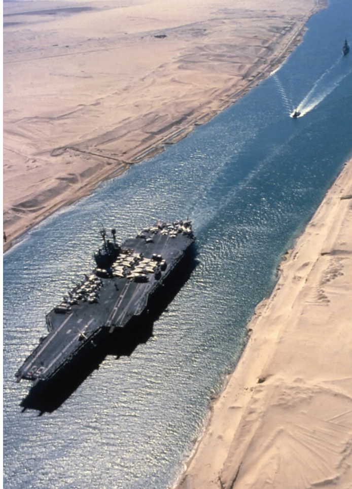
▲ Hadibajó a Szezi-csatornán

A hidegháborút követő két évtized során nem formálódott ki egy globális szintű intervenció alkalmazása, mely a megoldás lehet, csupán annak egy különös, unipoláris megvalósítási típusa bontakozott ki. Némi kozmetikázással az USA hegemoniája érvényesül e tekintetben. Új irányt jelöl az európaizáció processzusának gondolati és egyelőre fogyatékos gyakorlata, amely a nemzetközi jog primátusára épít. Az USA és az Európai Unió, továbbá bizonyos mértékben a NATO is olyan komplementer partnerségi viszonyban áll egymással, amelyben az USA nyújt védernyőt az EU-s modellnek, illetve diplomáciának,