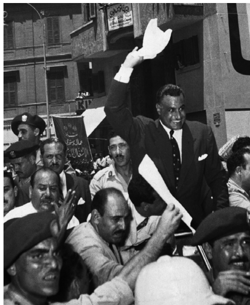
▲ Nasszer egyiptomi elnök

Szuezi nacionalizálásának lokális és globális kontextusa, s annak története ismert és szervesült a hidegháború bonyolult, ugyancsak tagolt időintervall-