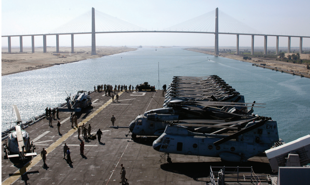
(U.S. Naval Forces Central Command, U.S. Fifth Fleet Combined Maritime Forces) http://www.cusnc.navy.mil

szövetséget, de önző szempontjaik, valamint az Iránnal, Szíriával szembeni félelmük az amerikai politika vállalásához kötötték őket.