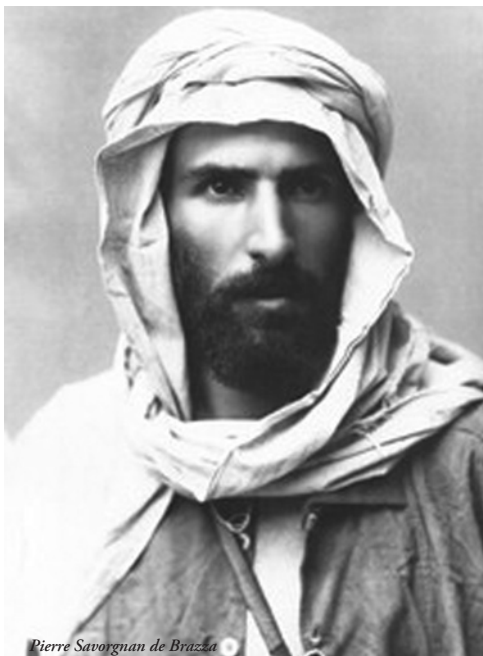
Pierre Savorgnan de Brazza

jével, a Makokoval, I. Iloy-jal aláírt Franciaország javára egy protektorátusi szerződést. A Makokot egyfelől kereskedelmi érdekei, másrészlől riválisainak gyengítése vezette a megállapodás szentesítésére. (Téké riválisai egy évvel később a brit Stanleyvel írtak alá egy barátsági szerződést a Kongó folyó bal partján, s ezzel kivonták magukat a Makoko és Franciaország fennhatósága alól).