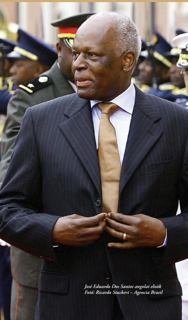
José Eduardo Dos Santos angolai elnök

A beavatottak köre később tovább bővült mind nagyobb hatalmi potenciált maga mögött tudva, mígnem 1993 novemberében a Falcone vezette