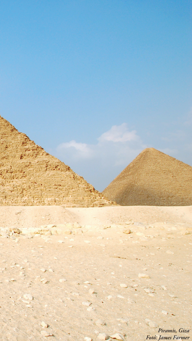
Piramis, Giza

professzort, az amerikai egyiptológust, Aaron Embert, és a papirusz szakértőt, Bernard Grenfelt sem kímélte az „átok”. Valójában a sírkamra megnyitóján ténylegesen résztvevő huszonhat személy közül „csupán” hatan hunytak el rejtélyes körülmények közepette, azonban ők sem gyors egymásutánban, hanem tizenhét év alatt. A többieket idős korban, természetes körülmények között érte a vég.