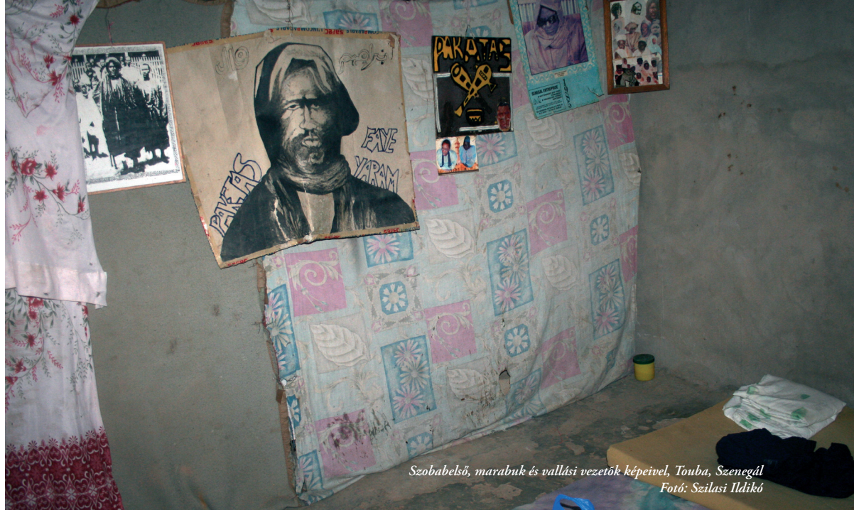
Szobabelső, marabuk és vallási vezetők képeivel, Toubá, Szenegál