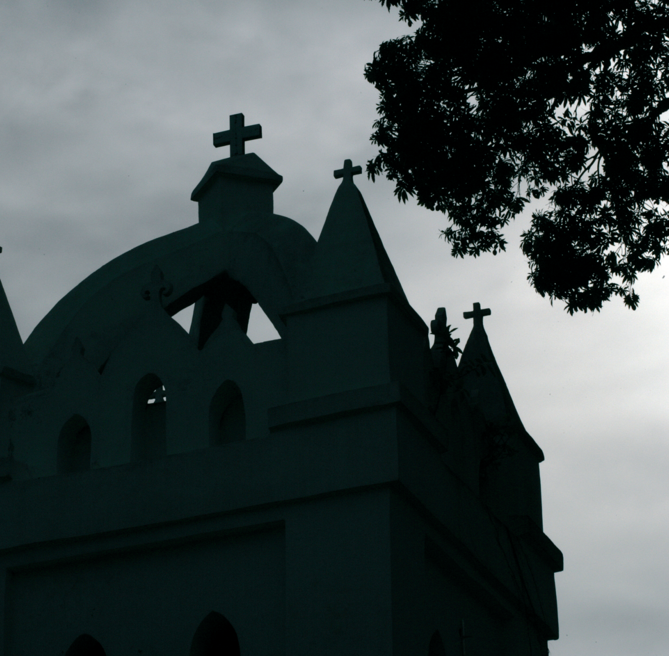
Livingstone Tower, Bagamoyo, Tanzánia