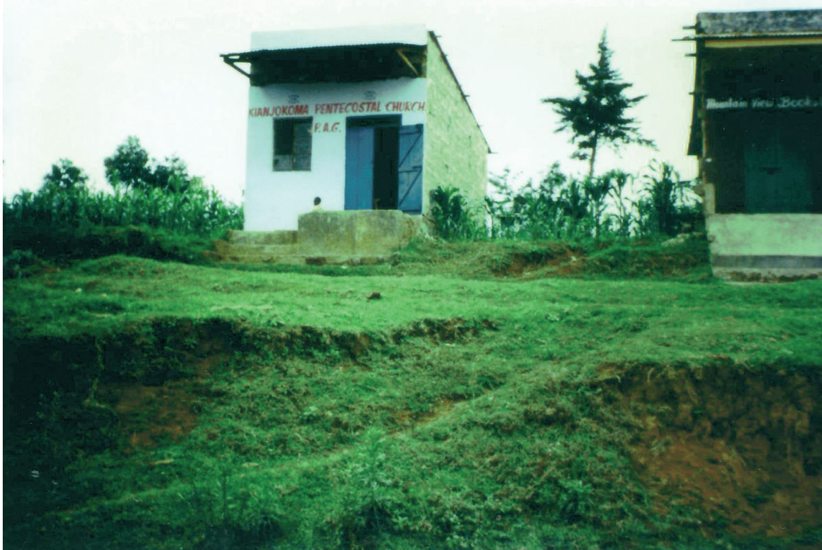
Pünkösdista templom Embuföldön, Kiriari

összekeverték a fa lehántolt kéregdarabjaival és a bárány gyomrának tartalmával. A szertartást vezető férfi a bárány bőrét keskeny, páros számú csíkokra vágta, aztán az előző keverékbe mártogatta és levelekbe csomagolta azokat. Az öregek felálltak és arccal a Kenya-hegy felé imádkozni kezdtek, majd a csomagocskákkal a kezükben elindultak. Minden egyes útkereszteződésnél megálltak, lyukat ástak, és belehelyeztek egyet a zsákokkákból. Így tisztították meg rituálisan a betakarítók lépteit. A csomagok egy részét a falusiak között osztották szét, hogy azokat a magtárakban helyezték el a betakarítás megkezdése előtt.