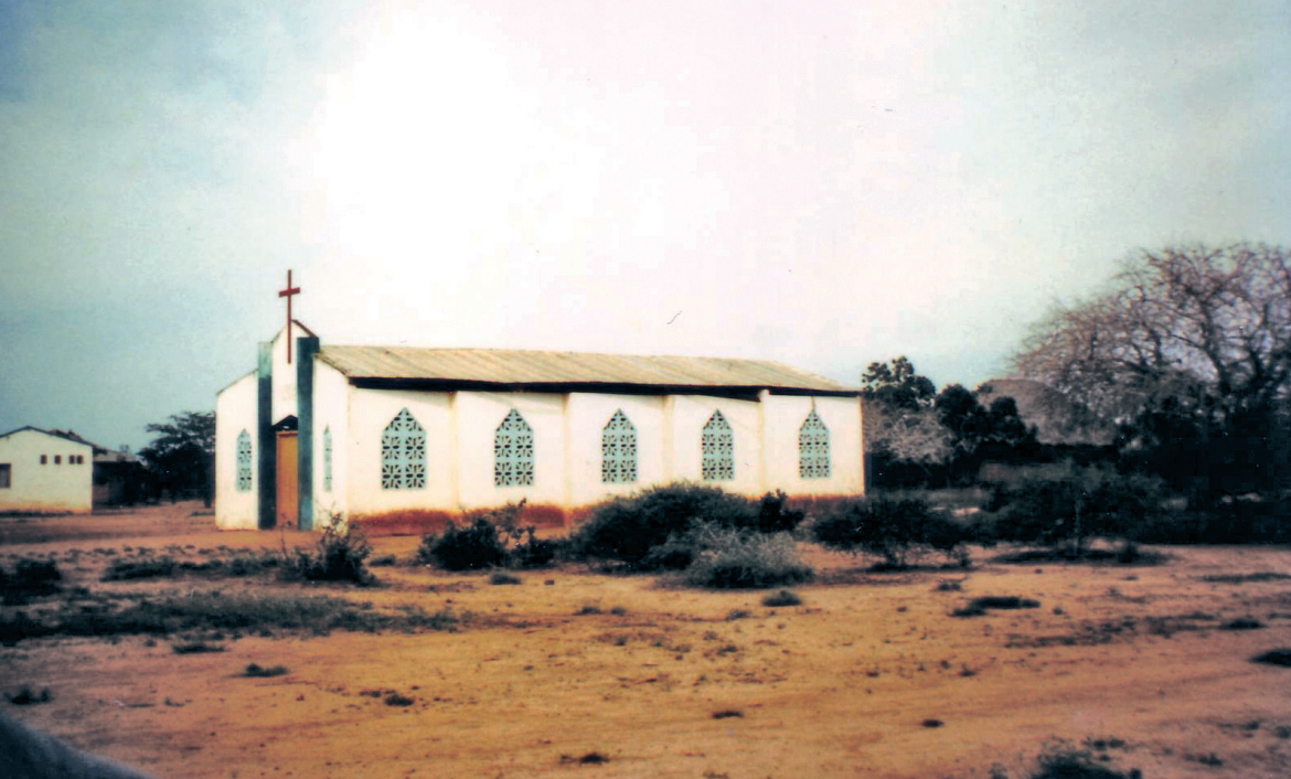
Katolikus templom Kelet-Kenyában

legyengült, így a férfiak lassanként átvették a hatalmat, többnejűsége épülő patriarchális rendszert vezettek be, s átnevezték a törzset Mumbi gyermekeiről Gikuyu gyermekeire. A klánok eredeti nevét az asszonyoknak azonban sikerült megőrizniük, azzal emléket állítva Gikuyu kilenc lányának.