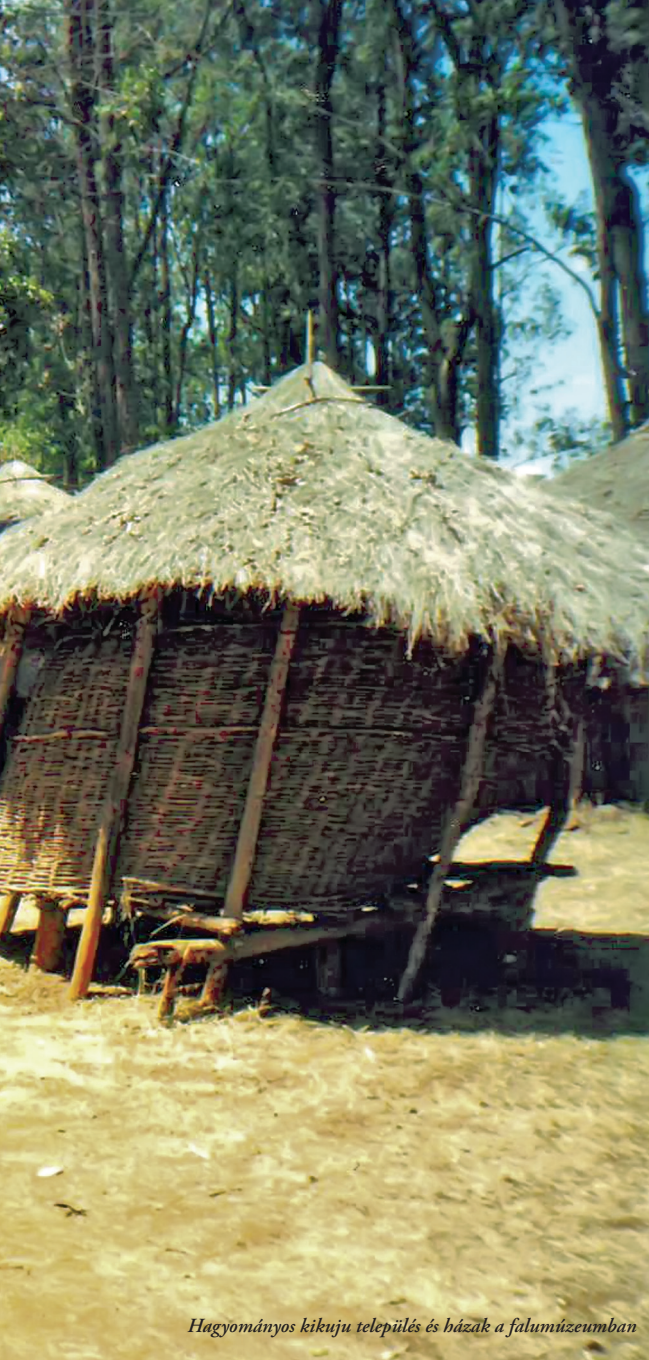
Hagyományos kikuju település és házak a falumúzeumban

különleges rítusok jelenítik meg az élet valamelyik szakaszából egy másikba történő átlépést. A szertartás az élet fordulópontját jelöli, erősíti a közösséget, védelmet nyújt az egyén számára, áldást hoz az életre, felelősségteljes viselkedésre és a helyes út követésére tanítja az embereket. Az élet sorsfordulónak valóságos ünneplése egy-egy szertartás, mely egyszerre őrzi és megújítja a hagyományokat, közösségbe kovácsolja a különböző korcsoportokat.