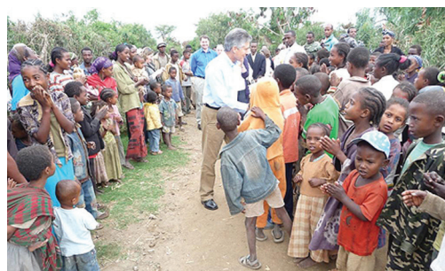
Az ausztrál külügyminiszter 2009-es etiópiai látogatása