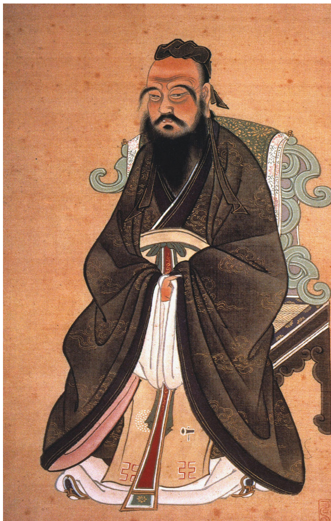
Konfuciusz, a mai kínai politikai kultúra egyik meghatározó filozófusa

A Pekingi konszenzus Cooper Ramo érvelésében három elméleti tételre épül: 1. Újrapozicionálja az innováció értékét. A legmarkánsabban élvonalbeli innovációra (például a száloptikára) van szükség a fejlődéshez, hogy olyan változást idézzünk elő, amely gyorsabban terjed, mint azok a problémák, amelyeket maga a változás hoz felszínre. 2. Azt rögzíti, hogy tekintettel arra, hogy a káoszt felülről nem lehet menedzselni, egy sor új eszközre van szükség. E második tétel olyan fejlődési modellt követel, amely nem luxusként, hanem alapvető elvárásként kezeli a fenntarthatóságot és az egyenlőséget. 3. Egyfajta új biztonsági doktrínát jelöl azáltal, hogy az önmeghatározásra épít, és azt nyomatékosítja, hogy van esély – például összefogással – befolyásolni a hegemon hatalmakat, amelyek érezhetik annak a csábítását, hogy „rálépjenek a kisebbek lábujjára”. Kína felemelkedése világosan jelzi a nemzetközi rend átalakulásának új szakaszát. Ma „egyre döbbenetesebb technológia ugrás kibontakozásának vagyunk a tanúi [Kínában], ami előrevetíti a feltartóztathatatlan gazdasági – s a további hatalmi – súlypont-átrendeződést [a nemzetközi rendszerben]. ... S ez még csak a kezdet, a „Nagy Sárkány” még messze van a teljes sebességtől.” 6