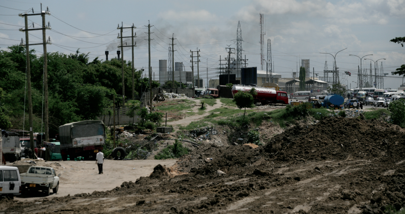
Afrika-szerte számos infrastrukturális beruházás ázsiai partnerséggel valósul meg

mítva – nem dúlnak államok közti háborúk. Enyhült az összecsapások súlyossága is, becslések szerint 1999-ben százezren vesztették életüket közvetlenül a harcok miatt, 2005-ben kevesebb, mint négyszázan. A határokat átlépő menekültek száma is csökkent: 1994-ben még majdnem 7 millióan éltek hazájukon kívül, 2007-ben már csak 2,5 millióan. De a kontinens nem csupán békésebb, liberálisabb is lett. A Freedom House – amely a világ összes országában méri a politikai szabadságot – indexértékei a Szaharától délre fekvő területen az elmúlt tíz évben jelentősen javultak.