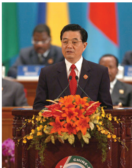
Hu Csin-tao kínai elnök köszönti a 2009-as Kína-Afrika Együttműködési Fórum résztvevőit az egyiptomi Sharm el-Sheikhben

A jótékony fellépésekben kétségtelenül benne van a maoista-kommunista szellemi örökség is: „segíteni a partnereken, a szegény testvéreken”, ezáltal tartósan megnyerni őket! (Afrika perifériális terépe volt a hidegháború korszakának. A világháború