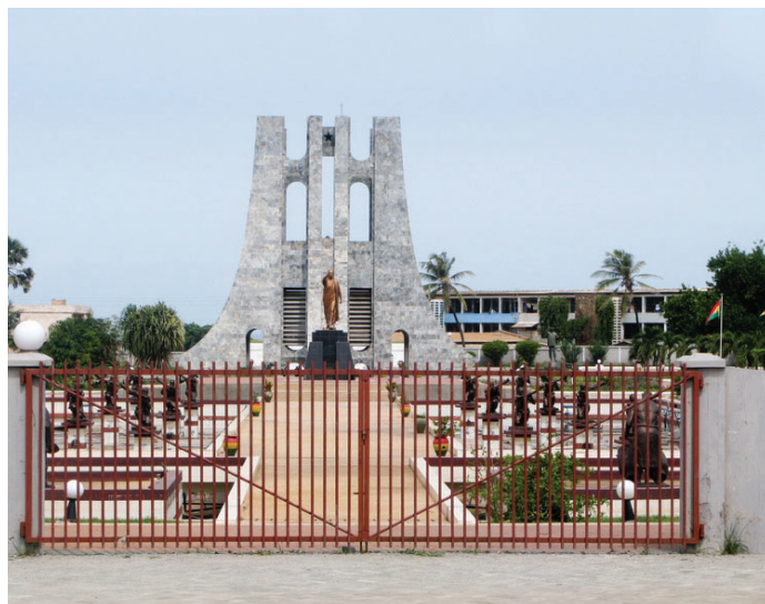
Az ikonikus Nkrumah emlékműve Accrában (Ghána)

utolsó – sorrendben az ötödik – Pán-afrikai Kongresszus helyszíne New York volt 1927-ben. Ez már az új, XX. századi ideológiák árnyékában zajlott le, és például a kommunisták egyenesen, mint kis-burzsoá fekete nacionalizmus hordozójára tekintettek a rendezvényre. 1936 után Nagy-Britannia vált a pán-afrikanista törekvések fő hirdetőinek hinterlandjává, de a második világháború befejezése cezúrát jelent a mozgalom történetében. A VI. Pán-afrikai Kongresszus, amelyet 1945 októberében tartottak Manchesterben, már az „új pán-afrikanizmus” jegyében zajlott le (Legum, 1965: 30-31).