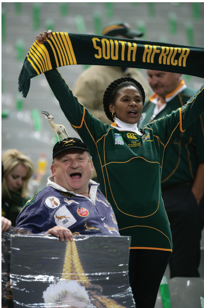
A dél-afrikai világbajnokság az egész kontinens számára integratív erővel bír

rika megteremtése. Az Egyesült Államok a 2001-es terrorcselekményeket követően egy új biztonságpolitikai doktrínát dolgozott ki 17 , melynek mondanivalója az, hogy az USA biztonsága alapvetően függ a harmadik világ államainak biztonságosságától és fejlettségétől, mivel a gyenge országok alkalmas fedezékül szolgálnak a terrorista csoportok számára. (Cilliers, 2003: