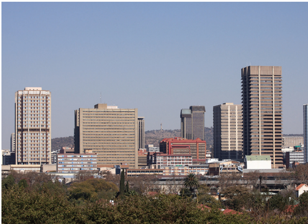
Pretoria City – nem csupán a Dél-afrikai Köztársaság, hanem az egész térség egyik fontos integrációs központja

William DuBois. Maga a szellemi áramlat ekkor még nem volt mentes a vallási elemektől sem. Ezenkívül ekkor még úgy gondolták, hogy a pán-afrikanizmus kérdése alapvetően a bőrszínnel és a rasszok egyenjogúságának problémájával hozható összefüggésbe. Amint DuBois megjegyezte: „Amennyiben a négerrek világtörténelmi tényezővé szeretnének válni, ezt kizárólag egy pán-afrikai mozgalom segítségével tehetik meg”, továbbá „a XX. század problémája a bőrszín problémája, vagyis a világosabb és sötétebb bőrű rasszok egymáshoz való viszonyának kérdése Ázsiában, Afrikában és Amerikában (idézi Legum, 1965: 24-25).” Az első Pán-Afrikai Kongresszus résztvevői egy memorandumot fogadtak el, melyet Viktória királynőnek is eljuttattak, amelyre Joseph Chamberlain akkori brit gyarmatügyi miniszter azt válaszolta, hogy: „Öfelsége kormá-