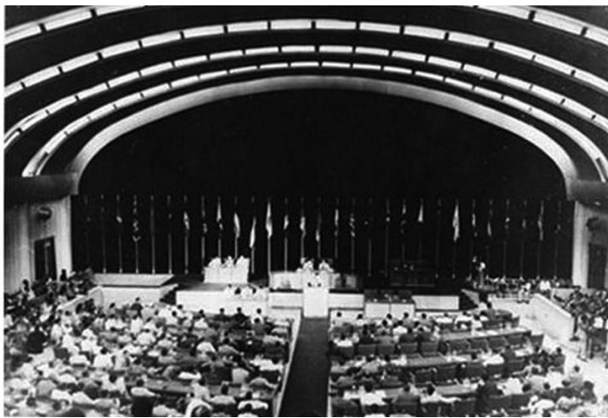
Az 1955-ös bandungi konferencia helyszíne

kintett (Legum, 1965: 33). A Titkárság azonban alig egy évig működött, majd egyik pillanatról a másikra elhalt.