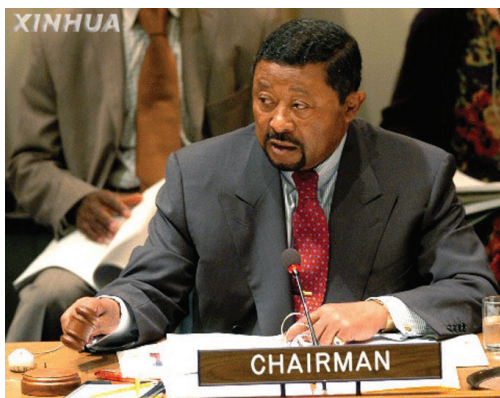
A gaboni Jean Ping, az Afrikai Unió bizottságának második elnöke

az „afrikai régió” terminust is, ez azonban nem azonos az RGK-kal 5 . Az Abujai Szerződés szerint a gazdasági integráció pilléreit jelentő Regionális Gazdasági Közösségek azok a szervezettek, amelyeket az AESZ, vagy később az AU ilyenként elfogadott. 6 Az Afrika Gazdasági Közösséget azonban még nem hozta létre az Abujai Szerződés, annak kivitelezésére ugyanis legalább harmincnégy évet adtak az afrikai állam- és kormányfők. Az AGK a szerződés hatálybalépését (1994) követően hat lépcsőben jönne létre, melyek közül az első etapban, (amely már megvalósultnak tekintendő) a már meglévő Regionális Gazdasági Közösségeket erősítették, illetve újakat is hoztak létre ott, ahol korábban ilyenek még nem működtek. A második lépcsőben összehangolják és harmonizálják az RGK-k tevékenységét, erősítik a szektorális integrációt, és előkészítik a vámtarifák és egyéb kereskedelem- és piackorlátozó intézkedések eltörlését regionális viszonylatban. A harmadik fordulóban, mintegy tíz év alatt alakulnának át az RGK-k regionális szabadkereskedelmi övezetökké, majd a negyedik lépcsőben legfeljebb két év alatt hangolnák össze az RGK-k vámpolitikai intézkedéseit egy Afrikai Vámunió létrehozása érdekében. Ezt követően