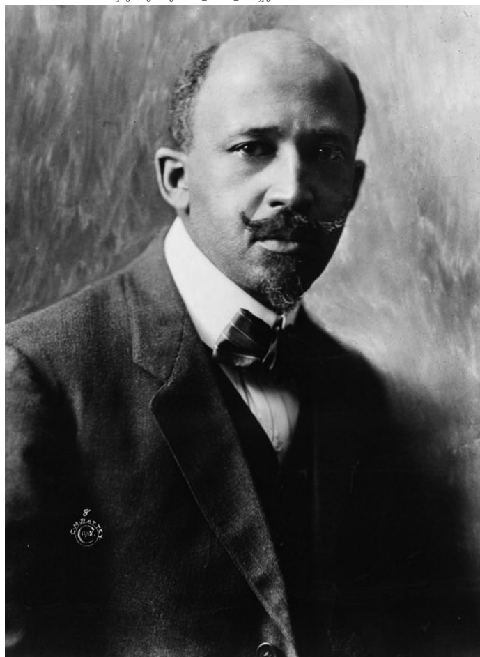
Az egyik legnagyobb pánafrikanista, W. E. B. DuBois

Edward Blyden alkotta meg az „afrikai személyiség” kifejezést, amellyel az amerikai feketék misztikus és távoli hazájára akarta felhívni a figyelmet (Collins, 1971: 150), de a jelenlegi ismereteink alapján, a „pán-afrikanizmus” kifejezést először Henry Sylvester-Williams trinidadai ügyvéd használta 1897-ben. Sylvester-Williams alapította meg 1887 körül a később Pán-Afrikai Egyesületnek nevezett Afrikai Egyesületet, majd az I. Pán-afrikai Kongresszus fő donátora is lett. (Legum, 1965: 24). Az első ilyen kongresszust 1900-ban szervezte Londonban a pán-afrikanizmus egyik atyjaként is tisztelt