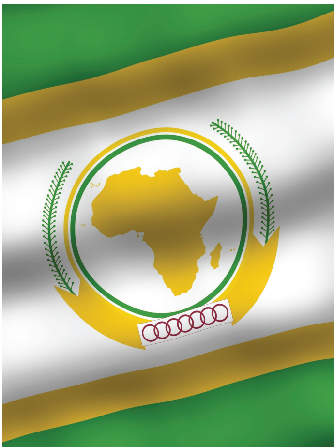
Az Afrikai Unió címere és zászlója

jelenti, melynek lényege, hogy a tagállamok egymás viszonylatában eltörlik a vámokat és mennyiségi korlátozásokat, de az integrációban részt nem vevő országokkal szemben mindenki önálló vámpolitikát folytat. A következő szint a vámunió , ahol a tagok már közös vámpolitikát folytatnak, és az áruk mozgása minden korlátozástól mentes az unión belül. Ezt követheti a közös piac , ahol már nemcsak az áruk, hanem a tőke, a szolgáltatások, és a munkaerő is szabadon mozoghat a tagállamok között. A gazdasági unió már a gazdaságpolitikák harmonizálását is jelenti, és végül a teljes gazdasági integráció már a monetáris- valamint a fiskális politikák egységesítését is megköveteli, továbbá egy a tagoktól független, de azokat kötelező