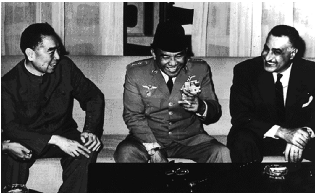
Csou En-laj kínai, Ahmed Szukarno indonéz, és Gamal Abden-Nasszer egyiptomi elnökök a bandungi konferencián 1955-ben

„civilizálták” a legszegényebb kontinens országait. Ennek alapján önálló tömböt alkotnak a frankofón, az anglofon, a luzitán örökségű, valamint a spanyol és olasz kolonizáció által befolyásolt országok. Fentiek mellett némiképpen „kakukktorjásnak” számít – a rövid olasz intermezzót nem számítva – végig szuverén Etiópia, és az egykori Amerikába hurcolt rabszolgák által megeremtett Libéria, valamint a sajátos történelmi fejlődésű Dél-afrikai Köztársaság. További – a dekolonizációból fakadó – probléma, hogy az uti possidetis iuris , nemzetközi jogelvének megfelelően, az afrikai államok örökölték a gyarmati területek (belső) közigazgatási határait, és ezek többnyire nem esnek egybe a nyelvi, vallási, kulturális, törzsi, etnikai, stb. határokkal. Kapcsolódva az előzőkhez, azt is megállapíthatjuk, hogy jöllehet Afrikában is a vesztfáliai modellnek megfelelően jöttek létre az államok, az ennek alapját képező nemzetfejlődés egyáltalán nem, vagy csak torz formában ment végbe a fe-