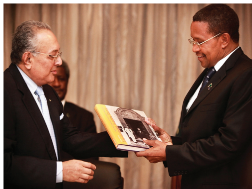
Kikwete tanzániai elnök a könyv dar-i bemutatóján

tározói – 1987-ben még csak 350 Toyota márkájú autót adtak el Tanzániában, 2000-ben pedig ez a szám 2000-et mutatott. Ugyan a család tagjai a világ minden táján megtalálhatók, többen közülük az Egyesült Királyságban, az Amerikai Egyesült Államokban és Mauritiuson élnek, a család történeté-