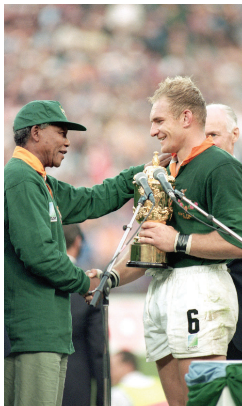
Nelson Mandela és François Pienaar

A filmforgalmazás furcsaságainak köszönhető, hogy Magyarországon végül nem került a mozikba Clint Eastwood Invictus című, 2009-es filmje (hanem lapzártánk idején, májusban jelent meg, végül csak DVD-n.). A John Carlin 2008-ban megjelent regényéből ( Playing the Enemy: Nelson Mandela and the Game that Made a Nation ) készült film 1995-ben játszódik, és a frissen hivatalba lépő Nelson Mandela elnök illetve a dél-afrikai rögbicsapat ka-