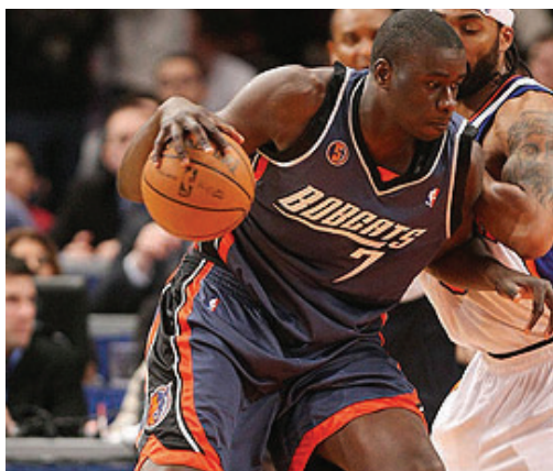
DeSagana Diop