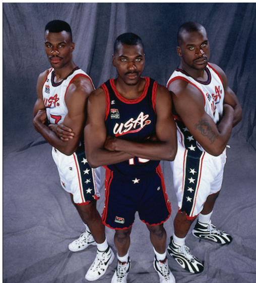
David Robinson (balra), Hakeem Olajuwon (középen) és Shaquille O'Neal (jobbra) a harmadik Dream Team tagjaiként

dődő Chicago Bulls korszak következtében a bajnoki címet nem sikerült megszerezniük. Ennek ellenére Olajuwon a mezőny egyik legsikeresebb és legszeníálisabb játékosává fejlődött. Több szezont is dupla duplával zárt, mely azt jelenti, hogy pontátlag 20, lepattanó átlaga 10 pont felett járt, de remek reflexeinek köszönhetően dobásblokkolási képessége sem hagyott kivetni valót maga után.