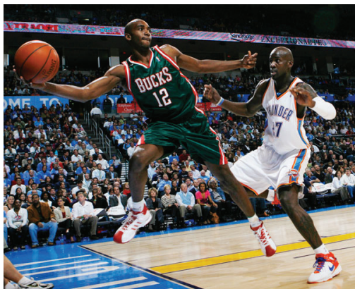
Kép: Luc Richard Moute (balra)

Milwaukee Bucks draftolta 2008-ban. A 2009-2010-es szezonban meglepetésre rájátszásba jutott az együttes, ahol Moute segítségével szoros küzdelmet vívtak az Atlanta Hawks csapatával, de végül búcsúzniuk kellett.