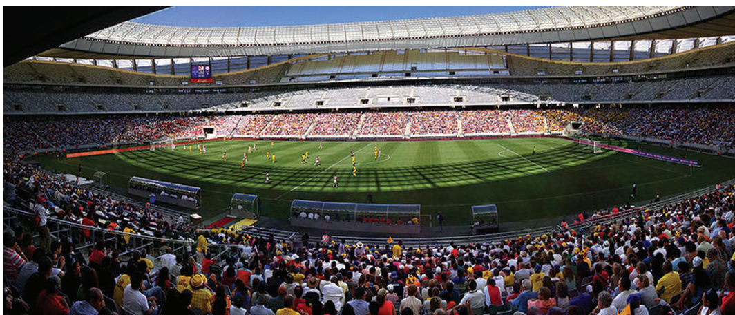
A fokvárosi stadion az avató-mérkőzésen