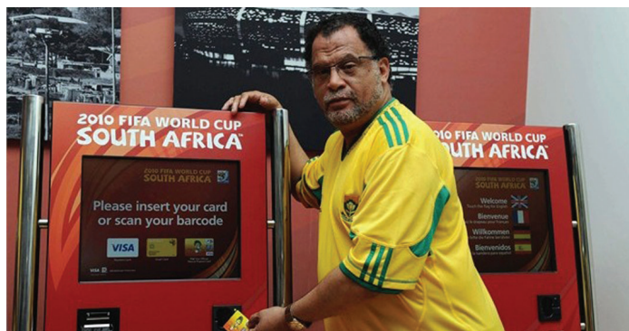
A jegyautomaták

A jegy-mizériát egy 2009-es FIFA sajtónyilatkozat indította el, noha akkor még nem tudhatuk, hogy a hírek mögött egészen más tények állnak. Az áprilisban kikerült anyag szerint a július 11-én sorra kerülő johannesburgi finálén kívül a nyitómérkőzésre és a két elődöntőre sem lehet már belépőt kapni. Teltházat jelentettek továbbá a vb-nek otthont adó városok közül Fokvárosban, Nelspruitban és Pretoriában. A hatalmas érdeklődés miatt a szervezők leállították a csapatbérletek árusítását Brazíliában, Ang-