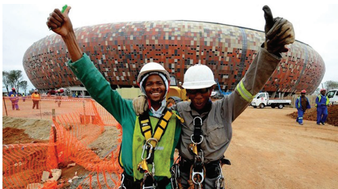
Boldog munkások, ingyenjegyet kaptak

nagy futballkultúrájú országban kerül megrendezésre az esemény, mint láthattuk 2006-ban Németország példáját, ahol kétszer nagyobb stadionokat is meg lehetett volna tölteni a szurkolókkal.