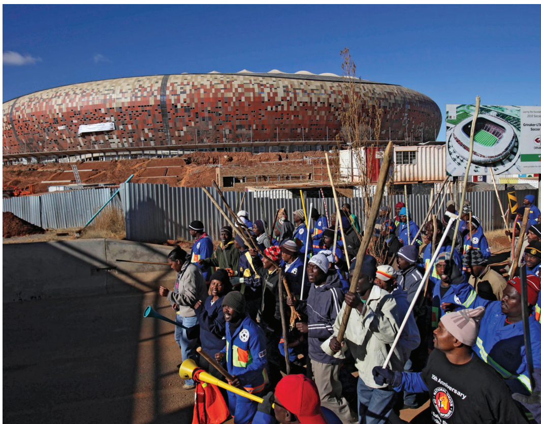
Újabb sztrájk a Futballváros mellett

kolói érdeklődés. Ezzel szemben úgy nézett ki, az idei esemény nem vonz annyi nézőt. Persze sok tényező közrejátszhat ebben (gazdasági válság, a helyszín, a közbiztonságról szóló ijesztő hírek, a jegyek magas ára), mindenesetre lehangelő látvány lenne, ha üresen kongának a felújított vagy felépített stadionok.