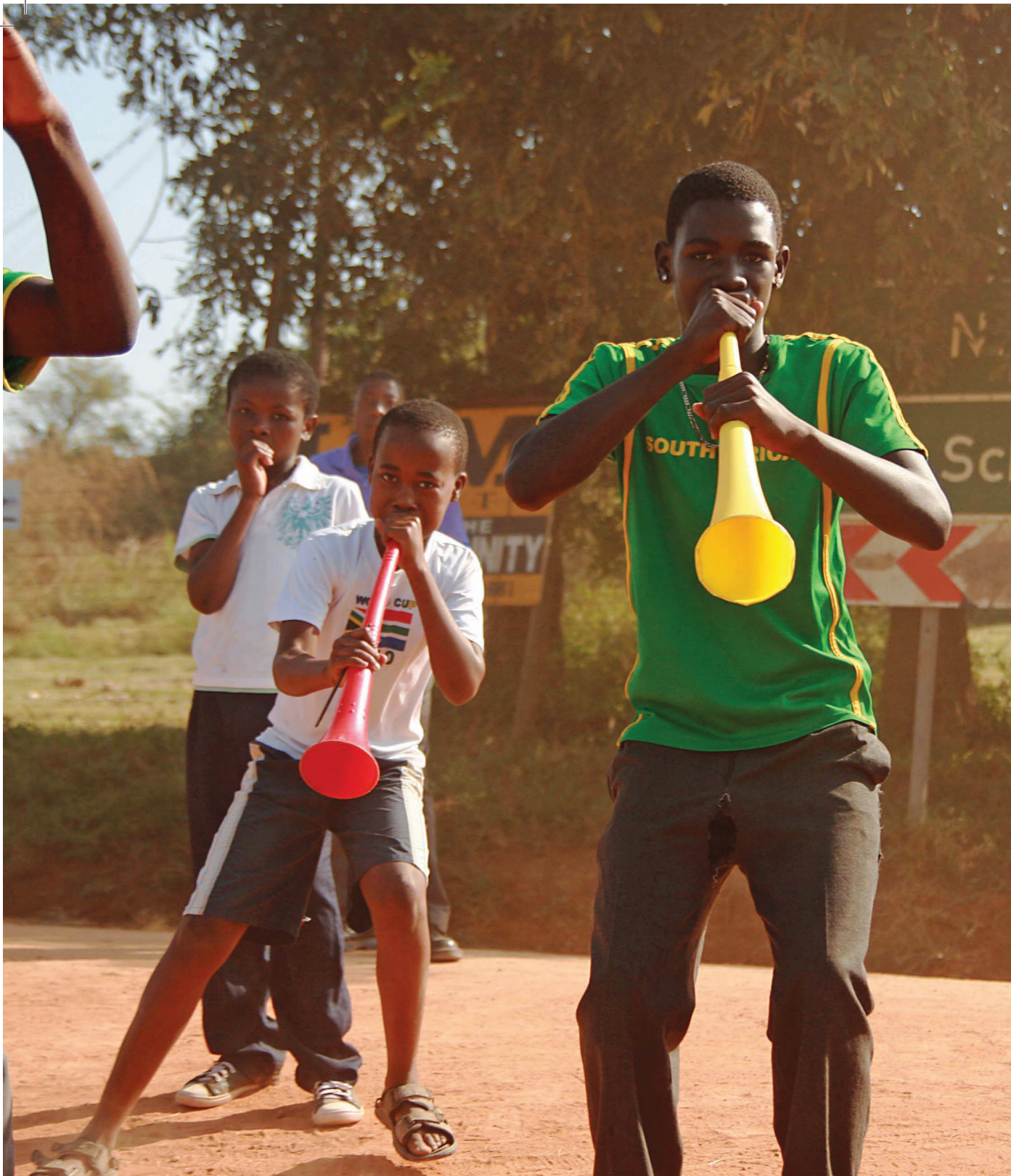
Dél-afrikai gyerekek

Törökország frissebb volt, játékán érződött a kivárárs. Mivel az összecsapás 0-0-ra végződött, következett a hosszabbítás, ahol már egyértelmű volt, hogy az afrikai csapat a tizenegyes rúgásokra apellál. A törökök azonban nem így gondolták. Egy gyors elfutást követően a szélről érkező beadásra İlhan Mansız érkezett és mesterien pörgetett a kapu jobb oldalá-