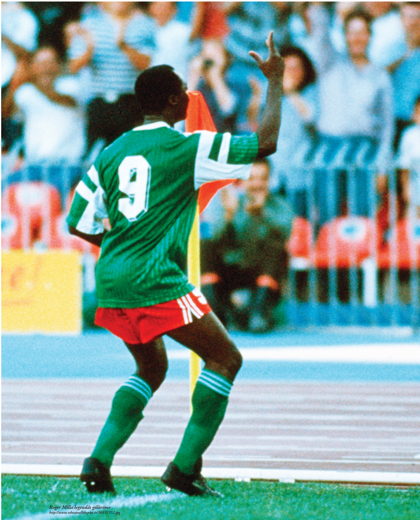
Roger Milla legendás gólöröme http://www.uboatallthepics.tv/56192552.jpg