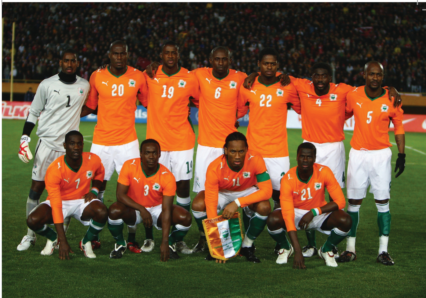
Elefántcsontpart nemzeti tizenegye

kapta magát, először egy kipattanó labdából egyenlített, majd Maradona zseniális kiugratását követően Caniggia találatával megfordította a mérkőzést. Nigéria vereséget szenvedett ugyan, de az utolsó fordulóban Finidi és Amokachi góljaival simán verte a rendkívül gyenge Görögországot és továbbjutott. A nyolcaddöntőben az afrikaiak azzal az Olaszországgal találkoztak, amely nagy nehézségek árán jutott tovább csoportjából és nem lehetett tudni, mikor talál önmagára. A mérkőzést iszonyatos melegben és nagy páratartalom mellett játszották Bostonban, ezért mindenki arra számított, hogy ez majd Nigériának kedvez, azonban az Európában légiós-kodó sasok éppúgy nem voltak már hozzászokva a szokatlanul nagy meleghez, mint az olaszok. Álmosan kezdődött az összecsapás, Nigéria megint az Argentína elleni taktikát alkalmazta, és úgy tűnt, ezúttal sikerrel teszi. Egy beadást követően Amunike már a 26. percben megszerezte a vezetést Nigériának, majd Zola kiállítását követően úgy tűnt, az afrikaiak továbbjutnak a legjobb nyolc közé. Jött azonban Roberto Baggio és Mussi beadásából a 89. percben egyenlített. A nigériai sztárok, mint az afrikai játékosok többsége nem bírták elviselni a nagy lelki nyomást, a kiélezett küzdelmet. Nem koncentráltak a mérkőzés lefújásáig, szinte a saját tizenhatosuk felénel védekeztek és ennek meg is lett az ered-