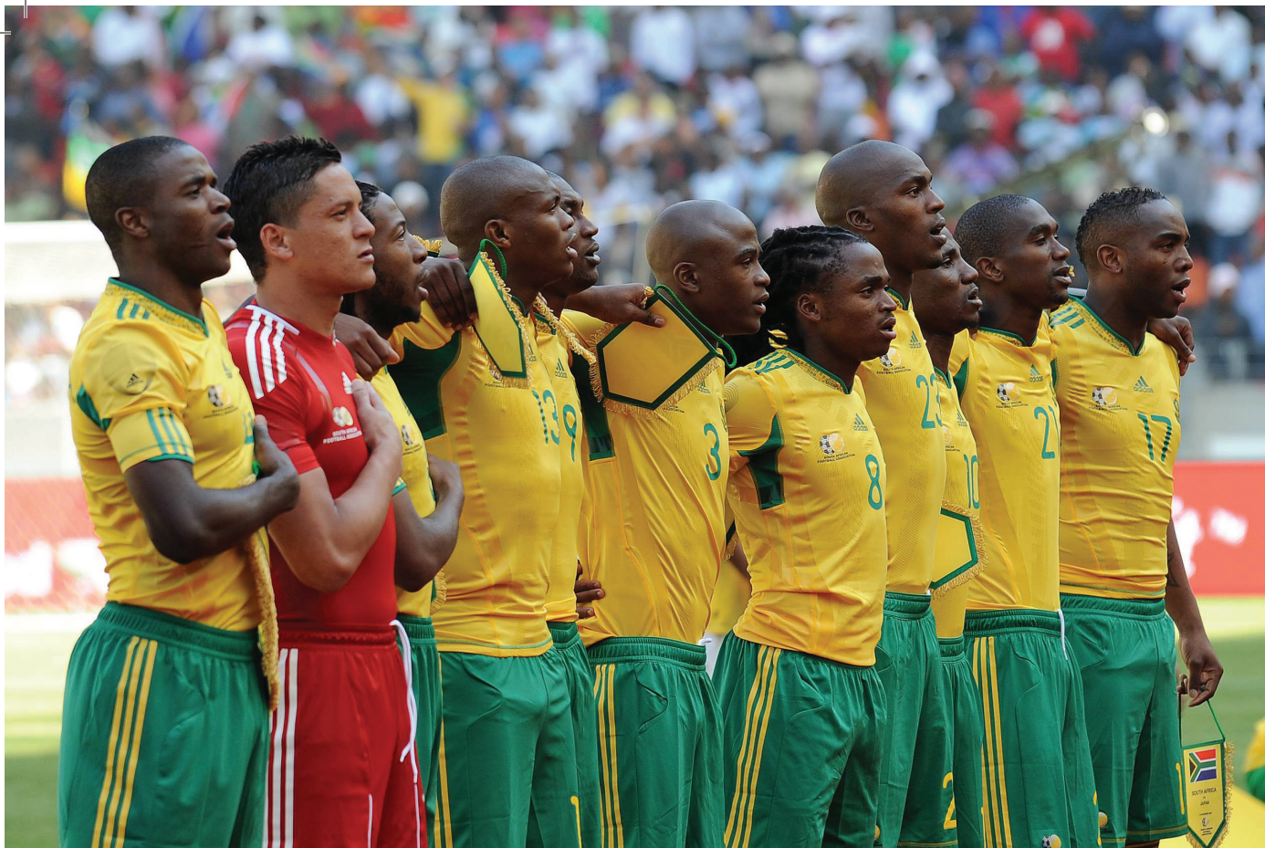
A bafana bafana http://z.about.com/d/goufrical/1/0/X/L/93055641.jpg

lőtték el Olaszországot, az ősi itáliai városok örült színekavalkádban pompáztak, a meccsek alatt kiürültek az utcák, a kávézók és sörözők azonban megteltek drukkerekkel. Az emberiség legnagyobb vallása, a futball hazaérkezett, megkezdődött az 1990-es labdarúgó világbajnokság. A nyitómeccsen Kamerun óriási csatában győzött Argentína ellen. Az elemzők értetlenül álltak az eredmény előtt, pedig már 1982-ben, a spanyolországi mundialén bontogatta szárnyait egy olyan afrikai generáció, amely kezdte eltanulni a labdarúgás csínját-bínját. A nyolcvanas években egyre több afrikai fiatal került nyugat-európai profi klubokhoz, ők már fizikálisan is fel tudták venni a versenyt európai, dél-amerikai társaikkal. Csapatként azonban nem szerepeltek jól, a taktikai fegyvelem abszolút hiányzott a játékból, nem tartották be a szövetségi kapitányok kéréseit, védekezésük lyukas volt, a lesreállítást sorozatban elvétették. 1974-ben Zaire volt az első afrikai csapat, amely kijutott a világbajnokságra, azonban egyetlen pont és rúgott gól nélkül távozott az NSZK-ban rendezett megmérettetésről. Ezután alakult ki az a kép a fekete kontinens csapatairól, hogy csupán pofozógép szerepét töltik be a világ labdarúgásában, és az igazság az, hogy volt is ebben a megalázó jelzőben igazság. Azonban, amikor 1978-ban, Argentínában Tunézia legyűrte a jó erővel felálló Mexikót, és afrikai csapatként először aratott győ-