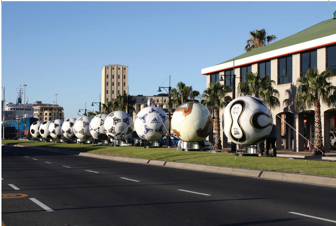
Óriáslabdák Fokváros központjában

tott: Spanyolország hogy fog állni az utolsó forduló előtt. Dél-Afrika leikszelt Paraguayjal, majd legyőzte az enervált Szlovéniát és bizakodva várta a már továbbjutott hispán alakulatót. A McCarthy és Radebe irányította afrikai gárda megszépen kezdett, Raul egy kapusról kicsorgó labdára lecsapott és már a 4. percben megszerezte a vezetést a spanyoloknak. Mint később kiderült, a hatalmas kapushiba Dél-Afrika kiesését eredményezte. Bár Arendse később óriási védéseket mutatott be és ezzel igyekezett jóvátenni hibáját, Mendieta és Raul is eredményes volt, így az afrikai csapat 3-2-re kikapott és búcsúzott a további küzdelmektől. Szenegál viszont átvette a „fekete ló” szerepét. Játéka kiszámíthatatlan volt, csatárai a legváratlanabb húzásokkal sokkolták az ellenfél hátvédőjét. A Dánia elleni 1-1-es döntetlen azt jelentette, hogy Metsu csapata ki-ki meccset játszhatott Uruguayjal. Dioufék a franciák ellen alkalmazott taktikára építettek, villámgyorsan elfutottak a széleken, a beadásokra pedig érkeztek a belső támadók. Ennek köszönhetően Szenegál 3-0-ra elhúzott és a zsebében érezte a továbbjutást. A dél-amerikai együttes azonban nem adta fel és Diego Forlan bombagólja után már csak idő kérdése volt, mikor jön az egyenlítés. A végeredmény 3-3 lett és ez azt jelentette, hogy Szenegál Oitában csapathozza az F csoportból első helyen továbblépett Svédországgal. A szakértők azt jóslták, hogy az európai