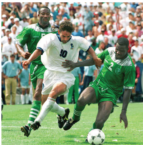
Nigéria-Olaszország nyolcaddöntő, 1994