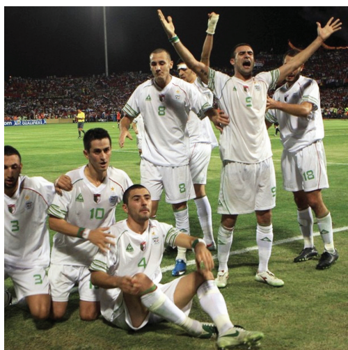
Az algériai válogatott az egyiptomiak elleni győztes meccs után

Milla örökké beírták magukat a futballtörténelem nagyjai közé. A világbajnokság után nyilvánvalóvá vált, hogy a tornákon való jó szereplés felkelti az európai klubok figyelmét. Ha egy afrikai játékos jól játszik, akár több, kecsesgetető ajánlat közül is választhat, így nem mindegy ki kerül be a csapatba és ott milyen teljesítményt nyújt. A tornák a kilencvenes években igazi játékospiaccá is váltak.