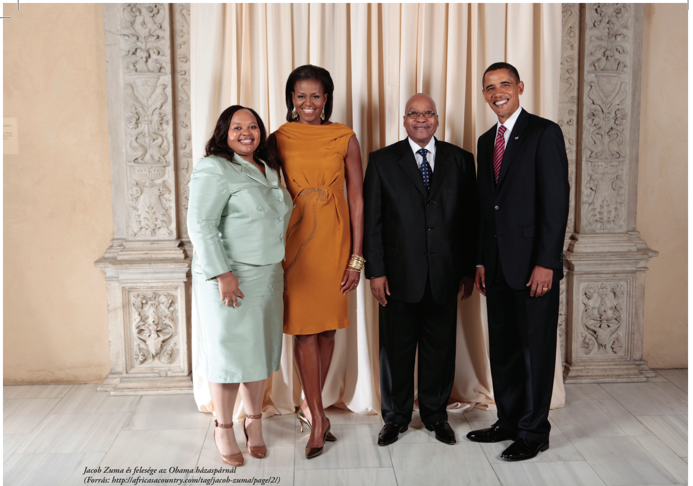
Jacob Zuma és felesége az Obama házaspárnál

lott. A dél-afrikaiak többsége úgy gondolja, hogy egy elnöknek példát kellene mutatnia népe számára, viszont egyre nagyobb számban vélik úgy, hogy Zuma saját magán kívül országa polgárait is lejáratja. Egy angliai bulvárlap például „szex-függő bigott” és „gonosz bohóc” megnevezéssel illette a dél-afrikai elnököt. Házasságon kívül született gyermekével kapcsolatban az ANC szóvivője, Jackson Mthembu feldúltan a következőket nyilatkozta: „Miért van az, hogy két felnőtt ember közti kapcsolat ekkora visszhangot vált ki? Miért kerülhet ez a hír egyáltalán a címlapokra? Miért kéne, hogy a nemzet ségyellje magát? Az elnök egyik vádpontban sem bűnös, és a dél-afrikai alkotmányt sem sértette meg!”.