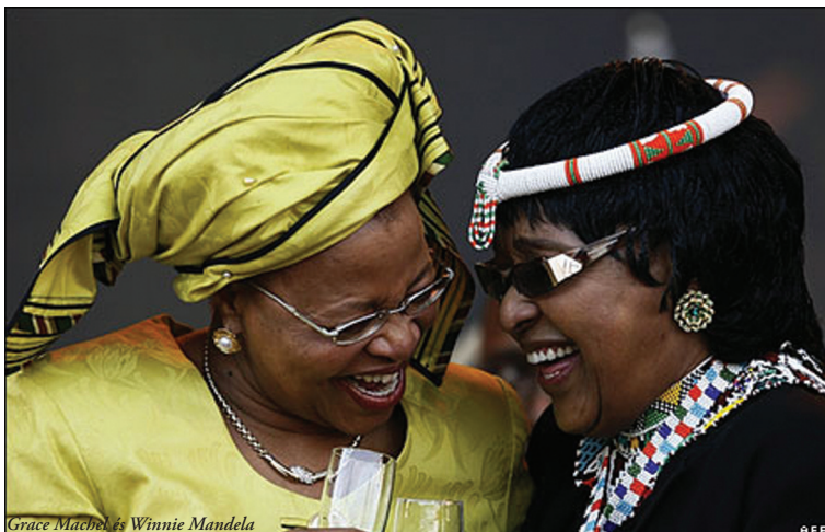
Grace Machel és Winnie Mandela

Mandela még válása évében ismert meg Winnie-t, egy szociális munkásként tevékenykedő fiatal hölgyet, akivel egy évvel később házasságot is kötött. A második ara tökéletes ellentéte volt Mandela előző feleségének. Winnie Mandela az egyik leghíresebb elnökfeleségként vonult be a történelembé, úgy is hívták Dél-Afrikában, hogy a Nem-