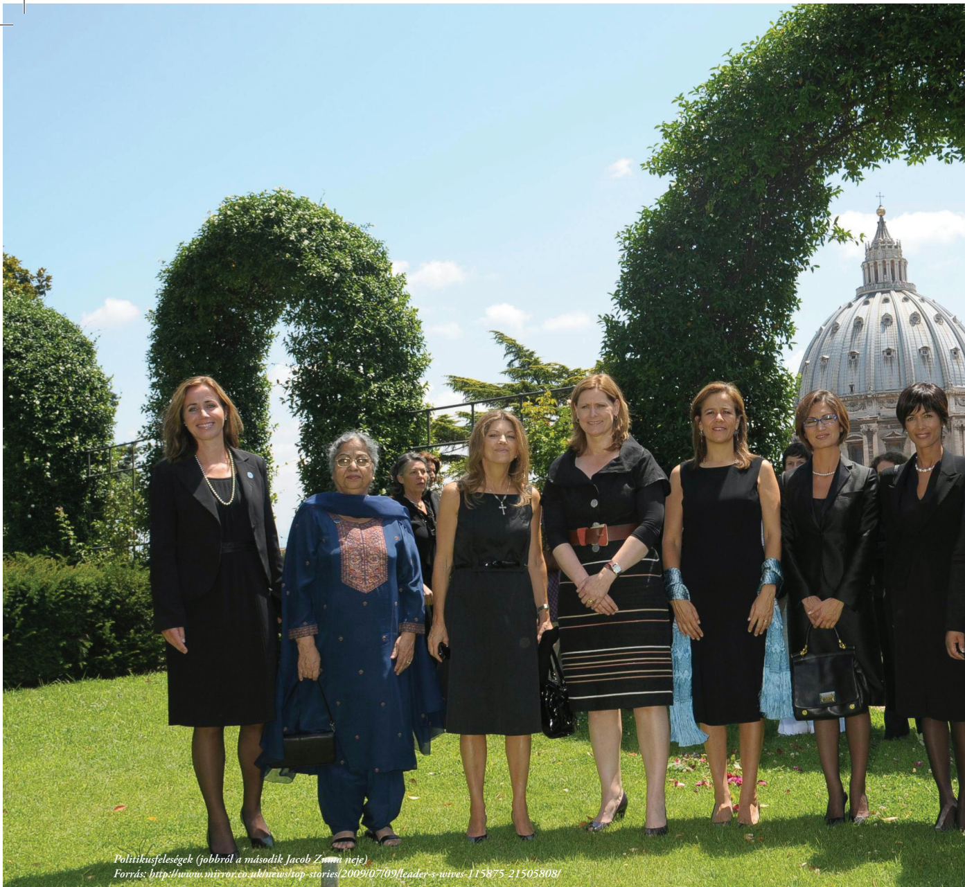
Politikusfeleségek (jobbról a második Jacob Zuma neje)

ugyanis egyvalamiben rekordernek számít. Ő az egyetlen nő a világon, aki két különböző nemzet elnökével is összeházasodott. Grace a Mozambikban található Gaza tartományban látta meg a napvilágot 1945-ben. Egyetemi tanulmányait Lisszabonban végezte, majd 1973-ban visszatért Afrikába. Ekkor csatlakozott a Mozambiki Liberális Front-hoz (Mozambican Liberation Front), és tanárként kezdett dolgozni, az ország 1975-ös függetlenedését követően pedig oktatási és kulturális miniszterré nevezték ki. Ugyanebben az évben kötött házasságot Samora Machel mozambiki elnökkel, aki 1986-ban egy máig tisztázatlan körülmények között történt repülőgép-szerencsétlenségben veszítette életét. A hölgy azóta számos tudományos díj és elismerés birtokosa, legtöbben mégis a Nelson Mandelával kötött házassága miatt ismerik világszerte. Az akkor még Dél-Afrika elnöki tisztségét betöltő Mandela a 80. születésnapján vette el Machel. Egyes híreszte-