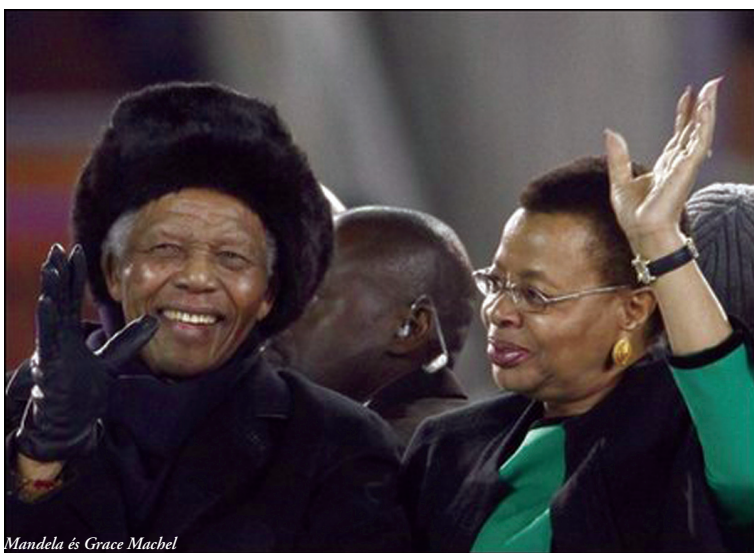
Mandela és Grace Machel

Forrás: http://www.thestar.com/article/834594--happy-92nd-birthday-nelson-mandela