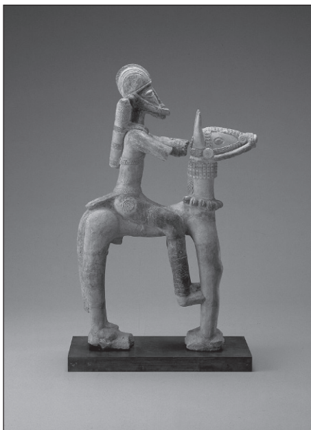
Mali lovas harcos.

Elődjéhez, Ulihoz hasonlóan Musza is részt vett a háddzson, ami közel egy évig tartott. 4 Utazása során a mai Mauritániát, Algériát és Egyiptomot is érintette. Kairói látogatásának itáliai kereskedők is szemtanúi voltak, akik aztán továbbadták Európában az uralkodó történetét. Musza manszát egy egész karaván, több tízezer – egyes elbeszélések szerint 60 ezer – ember kísérte. A hiedelem szerint az összes ember brokátot és perzsa selymet viselt, a teherhordó tevék szinte mindegyike 300 font aranyat cipelt. Az uralkodó lóháton uta-