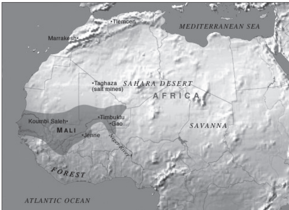
A Mali Birodalom területe a 14. század közepén.