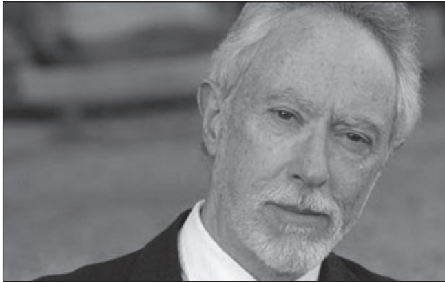
JM Coetzee.

esetében nem volt kérdéses az egyetemi diploma megszerzése. Coetzee a Cape Towni Egyetemen 1963-ban végzett matematika és irodalom szakon, melyet követően a londoni IBM-nél dolgozott számítógép programozóként. 1969-ben a Texasi Egyetem tanársegédi tevékenységének köszönhetően megszerezte a nyelv- és irodalomtudomány doktora címet. Coetzee szeretett volna az Egyesült Államokban maradni, letelepedési kérelmét viszont visszautasították, mivel határozottan álláspontot képviselt a vietnámi háborúval szemben. Az író így Amerikából visszatért szülőhazájába, a Dél-afrikai Köztársaságba, ahol nyugdíjba vonulásáig irodalmat tanított. Coetzee 2002-ben Ausztráliába költözött, 2006-ban pedig megkapta az ausztrál állampolgárságot.