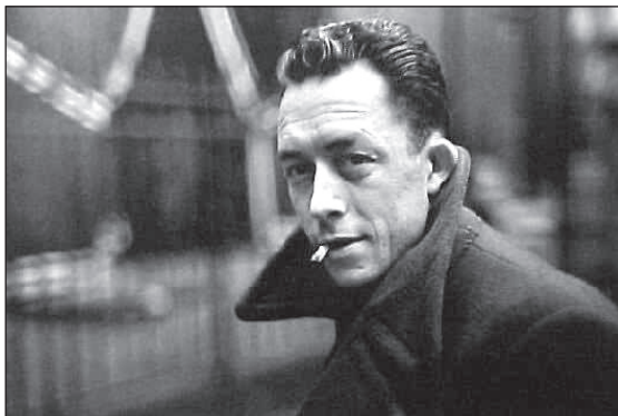
Albert Camus.

zottja. Az 1913 őszén született író az első világháború kezdetekor besorozott apját egyéves korában elvesztette, így anyai nagybátyjánál nevelkedett rendkívül szerény körülmények között. Camus 17 éves volt, mikor súlyos tüdőbajt diagnosztizáltak nála, így több hónapig tartó kezelésre utazott egy Dél-Franciaországban található szanatóriumba. Algériába való visszatérését követően anyjának gyermektelen nővéréhez és tehetős férjéhez került. Camus ebben a környezetben lényegesen jobban érezte magát, hiszen mostohaapja szintén nagy rajongója volt az irodalmi klasszikusoknak. Az irodalom és filozófia iránt intenzív érdeklődést mutató fiú 1932-ben érettségizett, majd tanulmányait az Algériai Egyetem filozófia szakán folytatta.