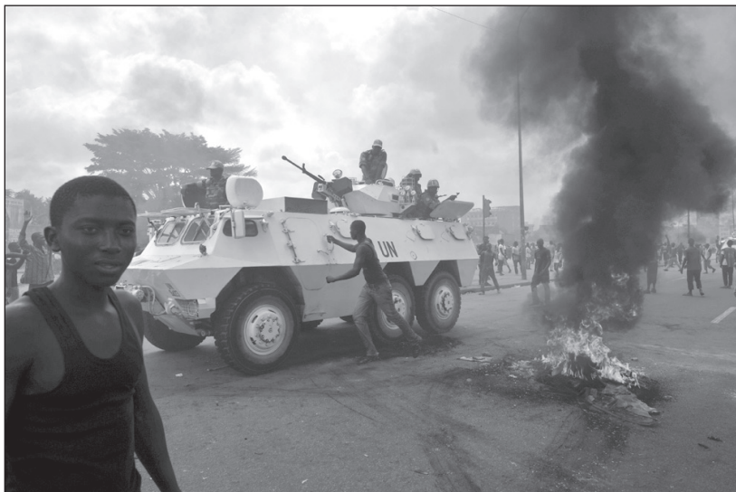
ENSZ békefenntartók Ouattara tüntető szimpatizánsai között.