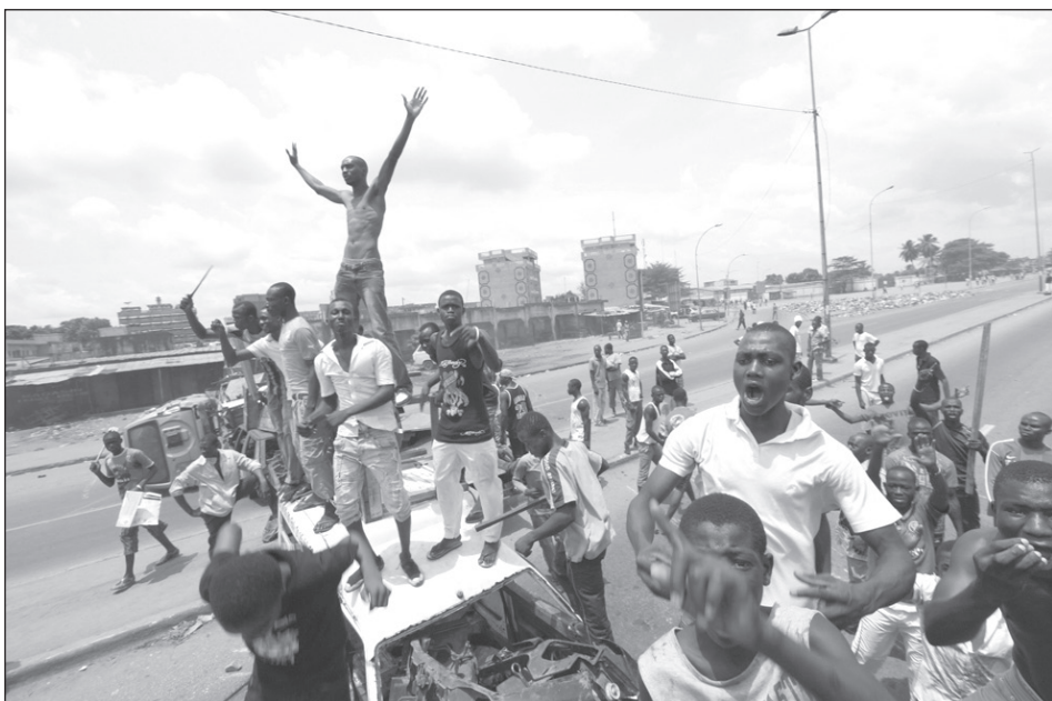
Ellenzéki tüntetők Abidjanban.

A nemzetközi közösség kérése és követelése ellenére azonban Laurent Gbagbót december 4-én ünnepélyes keretek között beiktatták államfőnek az elnöki palotában. Alassane Ouattara pedig „elnöki minőségében” tette le