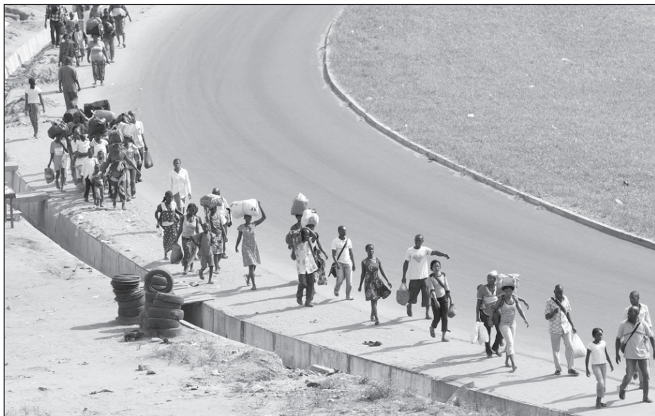
Ezrek hagyják el a fővárost az egyre véresebb összecsapások miatt.