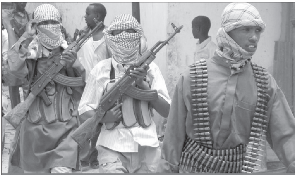
Az al-Shabab harcosai.

hogy stabilizálja a biztonsági helyzetet, az afrikai békefenntartók azonban csak minimális eredményeket értek el. 2009 januárjára az etiópok is megelégtették a költséges és kilátástalan gerillaháborút, és – erős ellenőrzést hagyva a határ mentén, olykor magában Szomáliában – kivonultak az országból. Az iszlám szélsőségesek megfékezésére csupán a nemzetközi közösség által anyagilag támogatott AMISOM és a TFG meglehetősen korlátozott erői maradtak az országban.