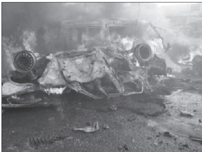
Mogadishu egy öngyilkos merénylet után.

és abba beépülve, a befolyásos pozíciókat (oktatás, egészségügy, igazságszolgáltatás) megszerezve igyekeztek minél erősebb hatást kifejteni a lakosság körében. Tevékenységük egybeesett a szomáli klánok napi igényeivel a rend és a kiszámíthatóság iránt, így 2000-re a különféle alulról jövő kezdeményezésekből megszületett az Iszlám