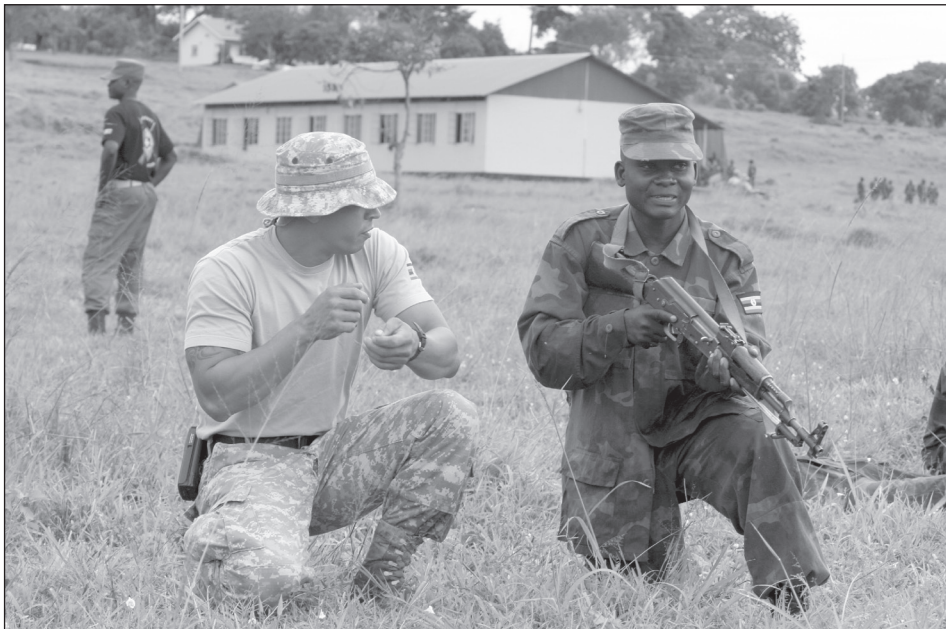
Amerikai kiképző valahol Ugandában. Szeretnék helyben tartani a problémákat.

rúk terhes öröksége – vadhajtságként nyert létjogosultságot. Az olyan egyértelműen irreális, globális célkitűzéseket, amilyeneket az Oszama bin Laden vezetett „ős al-Kaida” tűzött a zászlajára, elsősorban csak azért kerültek fel az afrikai mozgalmak ideológiai fegyvertárába, hogy megteremtsék az eszmei alapot a dzsihád fegyvereseinek és anyagi forrásainak szabad áramlásához. Éppen ezért azt is szem előtt kell tartanunk, hogy nagyon kevés klasszikus terrorcsoporttal találkozhatunk Afrikában: a legtöbb esetben olyan mozgalmak (például az al-Shabab) kerülnek fel a terrorszervezeteket tartalmazó listákra, melyek élnek ugyan terrorisztikus eszközökkel, mint az öngyilkos merényletek vagy a civilek elleni támadások, túszejtések. Ellenben szerveze-