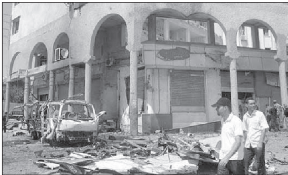
Algériai utcakép egy merénylet után.