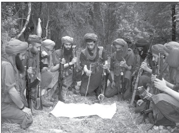
Egy AQMI csoport újabb támadásra készül.

Az al-Kaida maghrebi szárnya 2002-től vált egyre aktívabbá, s a szervezet még ugyanebben az évben felkerült az USA terrorszervezeteket felsoroló feketelistájára. 2002-ben még csak Algériában tevékenykedtek, ekkori legnevezetesebb akciójuk során rajtaütést szerveztek algériai katonák ellen. A tűzharcban