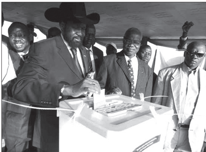
Salva Kiir leadja szavazatát.

majd Dzsubát 13 , s egy esetleges alternatív útvonal kiépítésével Kartúm ettől a bevételi forrástól is elesne.