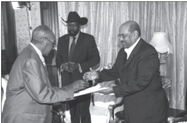
Al-Basír átveszi a referendum végeredményét a szavazást lefolytató bizottság elnökétől, Mohamed Ibrahim Khaliltól. A háttérben Salva Kiir.

Dél-Szudán a fejlődés útjára léphet és ehhez minden adottsága rendelkezésre áll. Azonban számos buktató áll az útjában, amely már több független afrikai ország számára túl nagy falatnak bizonyult, gondoljunk csak a Kongói Demokratikus Köztársaságra és a biztonságra, vagy Zimbabwére és a korrupcióra. Az ENSZ és az NGO-k jelenléte szintén lélegeztetőgépek a születő ország számára, a külföldi tőke pedig ugyan munkahelyeket teremt és fejlődést eredményez, nem segíti maradéktalanul a helyi érdekeket. A humanitárius segélyek és a külföldi beruházások nem helyettesíthetik a