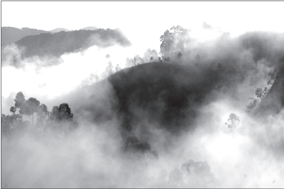
Bwindi hajnali ködben.

hanem az uralkodó tudományos és az aktuális politikai széljárás egyaránt befolyásolják. A tudományt tekintve jelen kutatás esetén a politikai ökológia (political ecology) eredményeit hívhatjuk segítségül, mely választ adhat a szegénység és a természeti környezet kölcsönhatásának dinamizmusára (Hutton, Adams – Murombedzi, 2005). Egyik elgondolása szerint a környezetrombolás elkerülhetetlen szükségszerűség, mert a mélyszegénységben élő közösségeknek nincs más lehetősége, mint a rendelkezésre álló erőforrások maximális kihasználása. Mindazonáltal a helyi közösségek negatív irányultságú, pusztító jellegű természeti tevékenysége csak egy válasz a különböző technokrata termelési elvárásokra és a központi hatalom beavatkozásaira. Az állam bizonyos törvényalkotási folyamatokkal, vala-