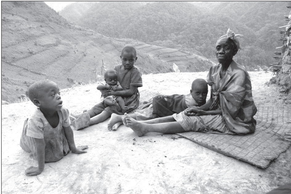
Egy család tagjai, háttérben a parkkal

További környezeti tényező a klímaváltozás miatt bekövetkezett szélsőséges időjárás, amely sokszor szárazságot idéz elő, ami az egyébként kiváló éghajlati adottságokkal rendelkező délnyugati