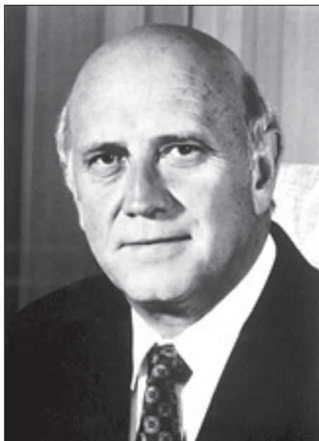
Frederik Willem de Klerk

De Klerk az apartheid rendszer utolsó éveiben a Nemzeti Párt tagjaként először oktatási miniszterként, majd 1989-től miniszterelnökként tevékeny