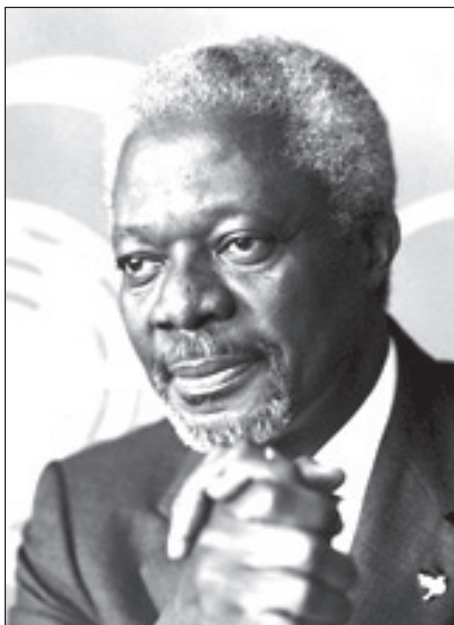
Kofi Atta Annan

újraválasztott, ezáltal tíz éven az ENSZ főtitkári pozícióját birtokló Annan először az Egészségügyi Világszervezetnél (WHO) állt alkalmazásban, majd humán menedzserként és főtitkár-helyettesként is dolgozott az ENSZ-nél. Annant 1997-ben és 2001-ben választották főtitkárrá, egyben ő volt az első fekete-afrikai, aki magáénak tudhatta ezt a pozíciót.