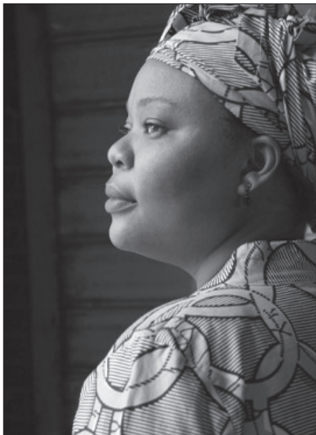
Leymah Roberta Gbowee

rangos elismerést. A bizottság mindhárom női aktivistának díjazását a következőképpen indokolta: „erőszakmentes küzdelmet folytattak a nők jogaiért, a politikai részvételért és a békéért”.