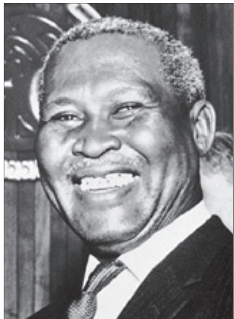
Albert John Lutuli

Albert John Lutuli az afrikaiak és egyben a Dél-afrikai Köztársaság részéről is elsőként részesült Nobel-béke-díjban. A fekete afrikaiak jogaiért harcoló mozgalom (1994-től már kormány-párt) az Afrikai Nemzeti Kongresszus (ANC) egykori vezetőjének pontos születési dátuma ismeretlen. Vélhetően 1898-ban látta meg a napvilágot az akkoriban Rodéziának nevezett területen található Bulawayo mellett. Lutuli apja keresztény misszionáriusként tevékenykedett, ám sajnálatos módon fia születése után alig pár évvel meghalt. Anyja így a család őseinek lakóhelyére, a KwaZulu Natal tartományban található Groutvillbe költözött vissza fiá-