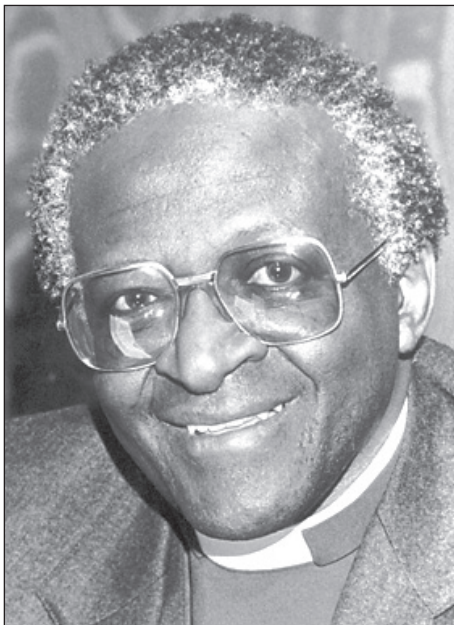
Desmond Mpilo Tutu

vízumkérelmének elutasítás miatt nem vehetett rész a Szent György katedrálisban tartott születésnap ünnepségén. Nobel-békedíjat 1984-ben az apartheid rendszer ellenes küzdelméért és a rendszer megszűnése után nyújtott szerepvállalásáért kapott. Nem csoda, hogy a Dalai Láma „Dél-Afrika élő lelkiismeretének” nevezi őt. Az emberiség sorsát a mai napig szívéen viselő Tutu a Nobel-díj mellett még számos kitüntetés tulajdonosa, ezek közül a legrangosabbak a következők: Pacem in Terris díj (1987), Gandhi Béke-díj (2005), A Szabadságért Elnöki Érdemrend (2009).