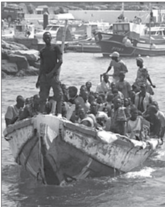
Sokszor embertelen körülmények között, a jobb élet reményében indulnak útnak

Ma is számos integrációs kezdeménnyel találkozhatunk Afrika-szer- te: Dél-afrikai Fejlesztési Közösség