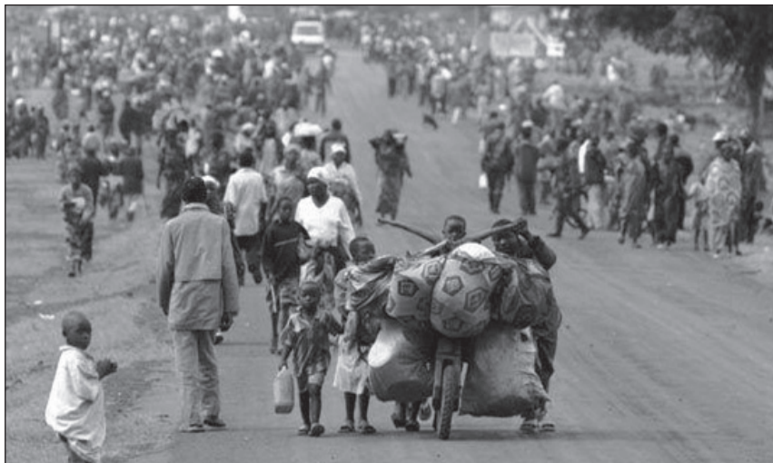
Számos afrikai országra jellemző látvány

Afrikában dolgozó vendégmunkások hazautalásaiból származik.