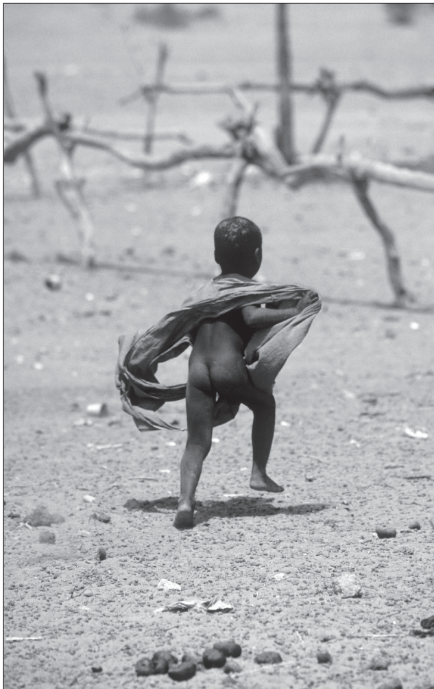
Kisgyerek Mauritánia aszály sújtotta térségében

vezető szerepre törekvő legerősebb „falkavezér” állam, mely önös érdekeit ambiciózusan (esetenként erőszakosan) is igyekszik érvényesíteni a többiekkel szemben. Ezek közé tartozik Nyugat-Afrika legnagyobb közösségén, az ECOWAS-on belül az anglofon Nigéria (frankofon versenytársának, Elefántcsontpartnak nincs esélye Afrika vezető olajhatalmával szemben), ahogyan a Kelet-afrikai Közösségben (EAC) Kenyáé a vitathatatlan elsőbbség, Közép-Afrikában pedig a Kongói Demokratikus Köztársaságé. A legkíméletlenebb módon a Dél-afrikai Köztársaság szupremáciája érvényesült az apartheid idején az általa vezetett, Afrika déli részére kiterjedő SADCC szervezetben. Azon túlmenően, hogy katonai intervenciókkal támogatta több társország konzervatív erőit, a belső országok külkereskedelmi forgalmának a saját kikötői felé fordításával ellenőrzése alá vonta a tagállamok gazdaságát. Az apartheid rendszer megszűnte után az egyenlőség elvére alapozottan létrejött utódon, a SADC-on belül Dél-Afrika betartja ugyan a közösségi politika játékszabályait, de a kiemelkedő teljesítményéből élvezett jól