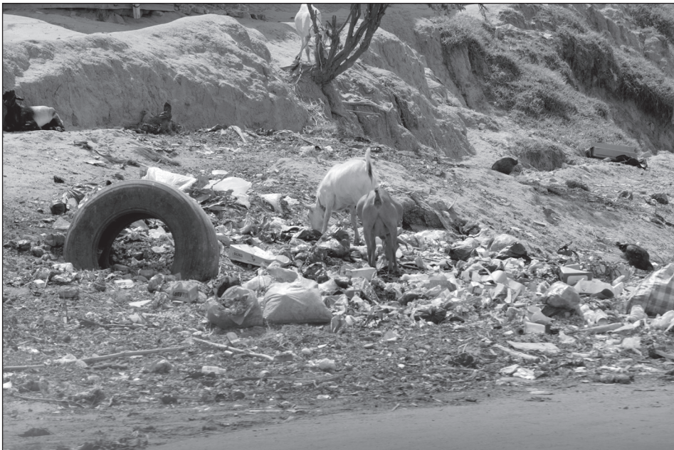
Szemétdomb az út szélén. Fotó: Kalmár Lajos, Kenya

Az afrikai mezőgazdasági területek 60%-ának termőképessége a talaj (számos okra visszavezethető) táperővesztésének és helyenként (pl. a nigériai olajmezőkön) az elszennyeződésének következtében degradálódott. Ez az arány