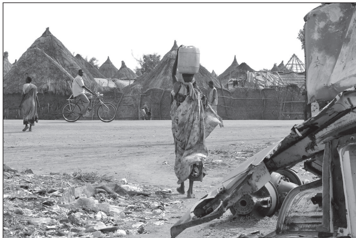
Egy szudáni asszony vizet visz családjának.

hetők, a természetes szaporodás üteme pedig sok összetevős szociálpolitikával lassítható. Sokkal nehezebb a klímaváltozás drámai méretű és mélységű kihívásaira hatékony választ találni. Ugyan századunk elején már számos összafrikai magas szintű tanácskozás foglalkozott e témával, de sem