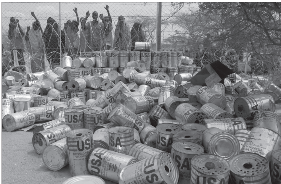
Üres növényi olaj konzervdobozok.

sére készülő politikai és katonai vezetés elképzelése az volt, hogy az Operation Restore Hope hadműveletet 1993 márciusára teljesítik, majd azt követően az Egyesült Államok átadja a feladatot az ENSZ-nek. 31