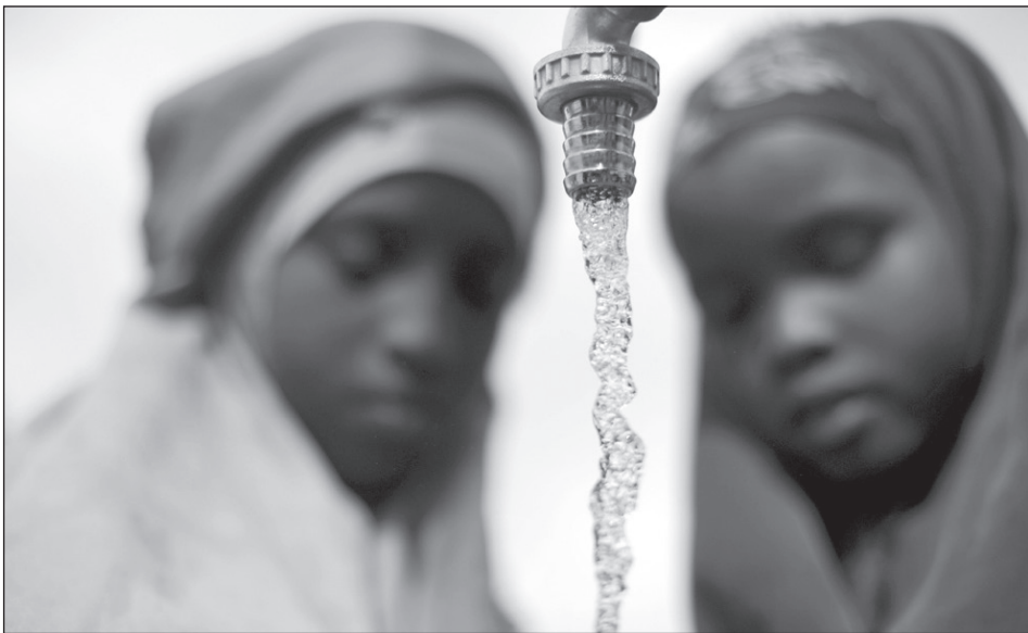
A víz a legnagyobb kincs a menekülttáborokban.

A Szomáliában fenyegető éhínség hírére a világ, amely ekkoriban a Balkánon kibontakozó krízissel volt elfog-