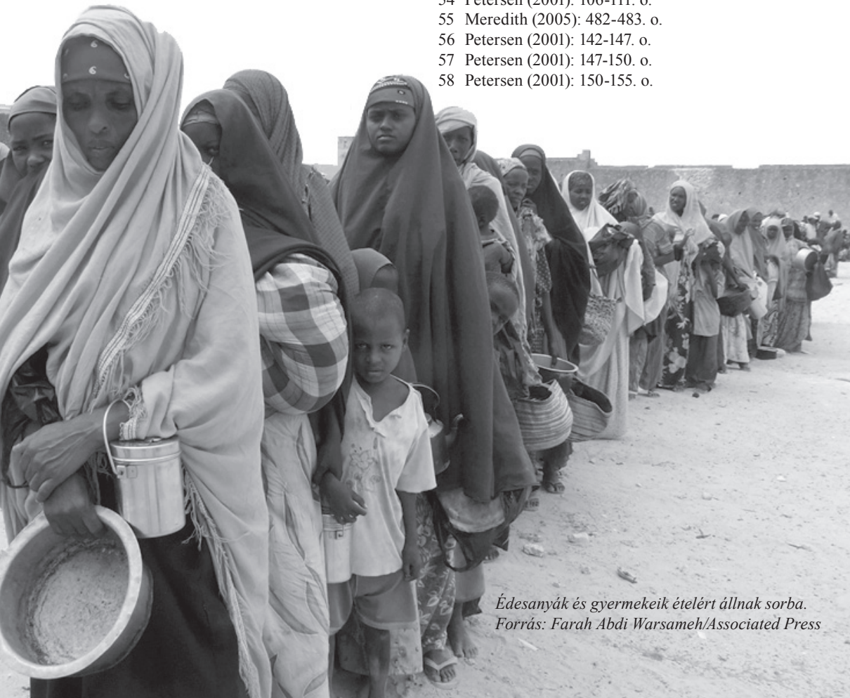
Édesanyák és gyermekeik ételért állnak sorba.