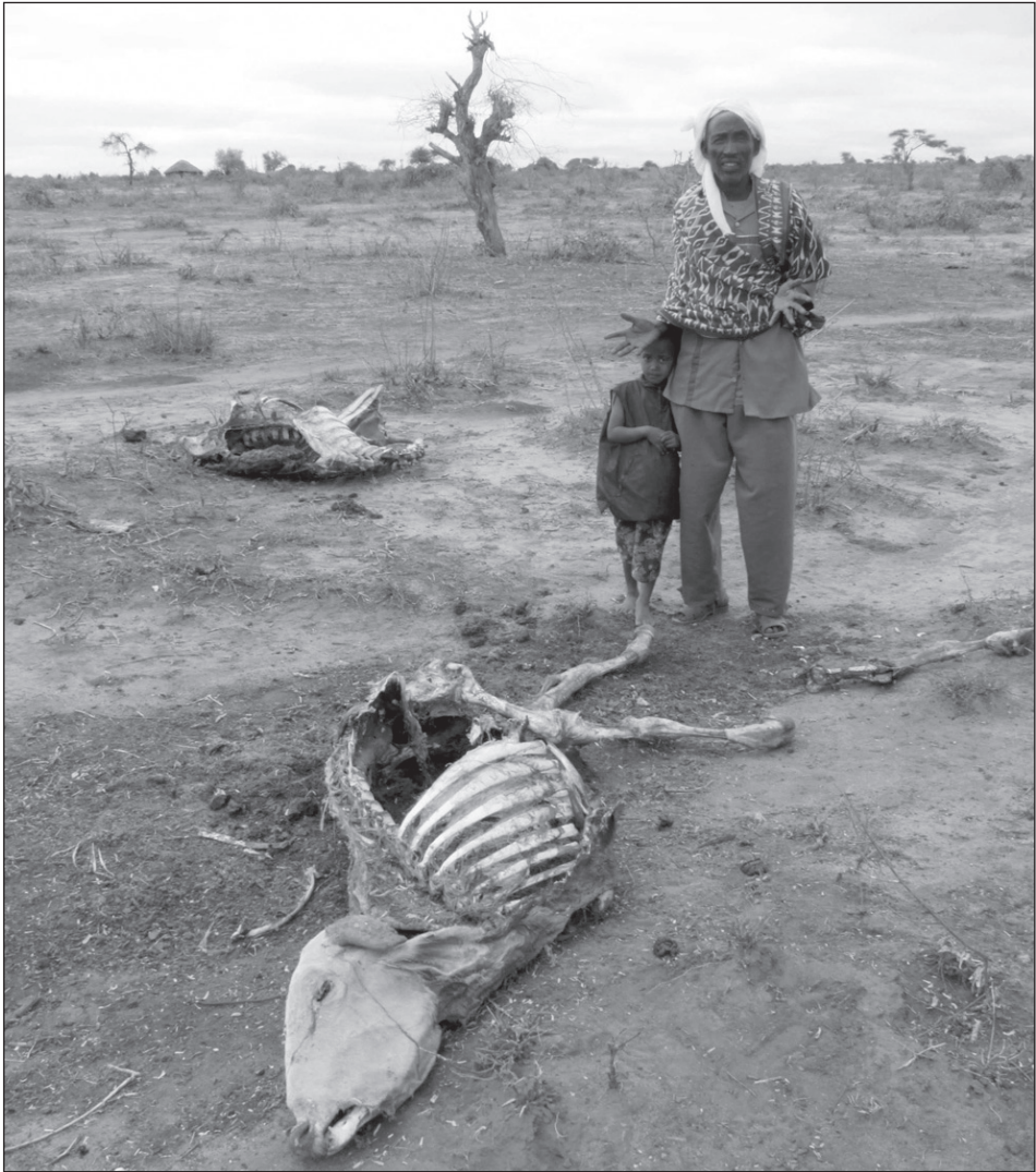
A szárazság az állatokat sem kíméli.

emberei a Bakara piac mellett a Black Sea körzetben lévő épületben gyülekeznek, a támadás megtervezésénél a megszokott sablont alkalmazták. A körzet Aidid fellegvára volt, tele állig fellegyverzett milicistákkal, éppen ezért rizikós volt hadművelet végrehajtása. A támadásra 16 helikoptert, Rangereket,