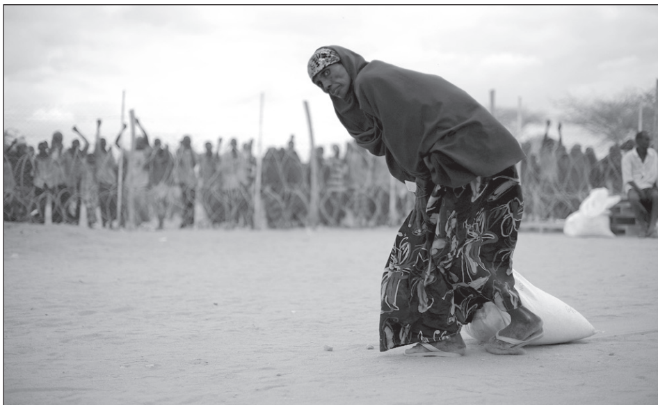
Egy menekült élelemhez jut a dadaab-i táborban.

vel rendelkezett, ami kétségbeejtően kevés volt ahhoz, hogy erőműveket, utakat, iskolákat, csatorna- és vízhálózatot építsenek. 9 Más afrikai államokkal ellentétben azonban Szomália erős nacionalista érzülettel ugrott neki a függetlenségnek, aminek alapja a közös nyelv, a pásztori társadalom hagyományain és tradícióin alapuló kultúra, valamint az iszlám hit volt. Harcias híruknek köszönhetően a szomáli területek lakossága egységesen homogén tudott maradni, azonban az 1960-ban bekövetkezett függetlenség nem volt teljes, mivel nem az eredeti Nagy Szomália területei váltak egységesen függetlenné. A Kenya északi részén fekvő szomálik által lakott területek, valamint Ogaden és Dzsibuti továbbra is idegen országok fennhatósága alatt maradt. Ugyanakkor a függetlenné vált területeken a belső egység megteremtése óriási kihívást jelentett, mivel a szenvedélyes nacio-