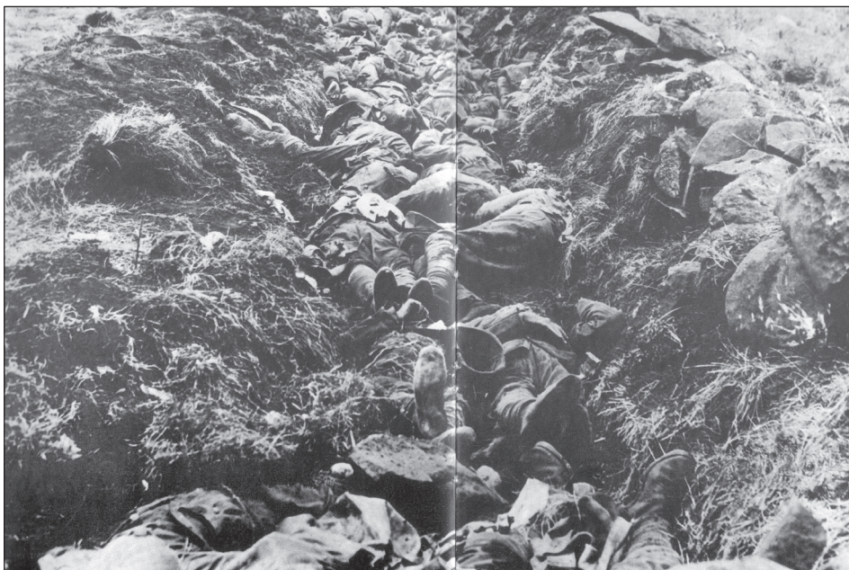
Holtestek a Spion Kopon másnap reggel.

kát látta annak, hogy Nagy-Britannia a létére tör. Habár a búr-német szövetség nem lett szorosabb Nagy-Britannia is rádöbbsent, hogy Dél-Afrika gazdag régió, kereskedelme ezer szállal kapcsolódik Angliához, így fontos része lett a gyarmatbirodalomnak. Az új gyarmatügyi miniszter, az imperializmus és a birodalom lelkes híve, Joseph Chamberlain, valamint Dél-Afrika új főmegbízottja Sir Alfred Milner létkérdésnek tartotta, hogy Nagy-Britannia befolyása megkérdőjelezhetetlen legyen a régióban. 43 Azt, hogy az érdekek mennyire összetettevé váltak a térségben, jól szemlélteti a portugál területen fekvő Delagoa-öbölben történt kikötő fejlesztések, és az ahhoz vezető vasútvonal kérdése a század végén. A legtöbb dél-afrikai háborúról szóló beszámoló