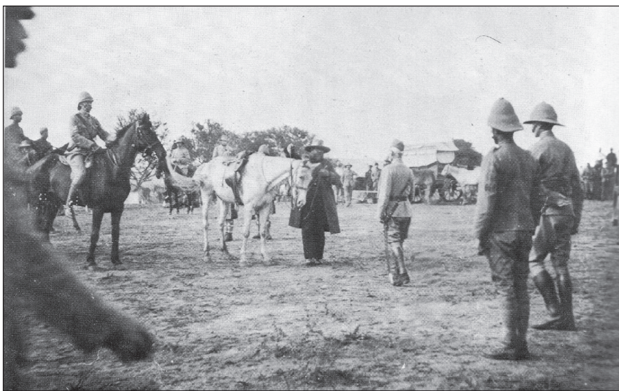
Cronjé leteszi a fegyvert lord Roberts előtt Paardebergnél.

Louis Botha, Christian de Wet, Olivier, Kritzinger, Hertzog vagy Koos de la Rey. Az angolok kezdetben nem tudtak hatékonyan fellépni a búr kommadók akciói ellen és meglepően nagy veszteségeket szenvedtek a náluk jóval kisebb ellenségtől. A búrokat segítette a helyismeret, a mobilitás, mindenki lovon közlekedett a kommandó tagjai közül és a meglepetés ereje. A probléma leküzdésére az angolok drasztikus megoldást választottak. Még Roberts parancsnoksága idején adták ki a parancsot a farmok megtorlasként való felgyújtására, mivel a búrok az utánpótlásukat és információikat jórészt innen szerezték. 71 A másik, még nagyobb visszhangot kiváltó intézkedés a koncentrációs táborok létesítése volt. Mégis, még két év kellett, hogy a felek békét kössenek. Ezt 1902. május 31-én Vereenigingben írták alá. Az angol feltételek nem voltak