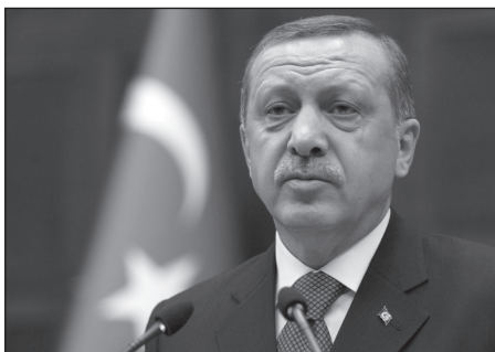
A török pragmatikus külpolitika is beleszóllhat.

Irán ahol az 1979-es forradalom után Khomeini egy rendkívül sajátos, egyben demokratikus és iszlám teokratikus államot épített ki, mely azóta is Irán politikai berendezkedésének alapját adja (Csicsmann, 2006. 235. o.). Szintén követendő példa lehet a jelenlegi líbiai vezetés számára, főleg a teokrácia elmélete, melyet ezért érdemes közelebbről is megvizsgálni. A teokrácia, a görög „Theosz”, vagyis Isten és „krateia” uralom szavakból áll, tehát morfológiailag istenuralom-ként definiálható. Olyan