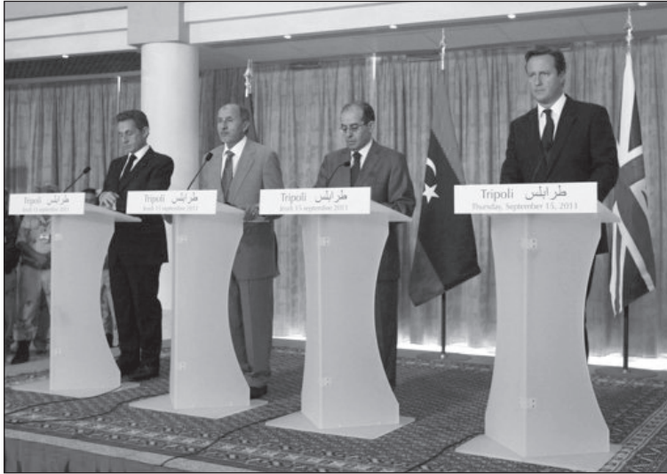
Ki mondja meg mi lesz Líbiával?