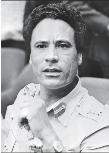
Moammer Kadhafi az 1975-ös kampaljai Afrika Egységsszervezet csúcsertekezletén