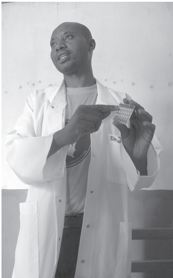
5. kép. A biruwei doktor magyarázza a fogamzásgátló tabletták helyes használatát.