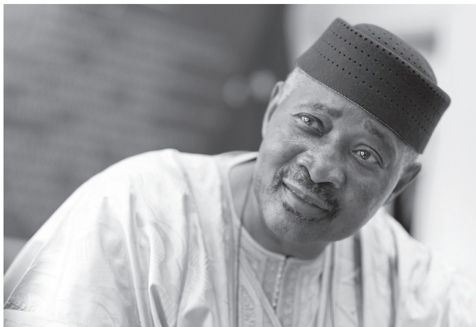
▲ Amadou Toumani Touré.

Úgy tűnt tehát, hogy a probléma megoldásának a kulcsa Algír kezében van. A nyugati országok képviselői gyorsabb fellépésre ösztökélték az algériai vezetést, ám az algériai, sőt a mali sajtó is azzal vádolta őket, hogy csak saját érdekeiket tartják szem előtt. De kiderült, hogy másfajta problémák is felmerültek: a közös – algíri