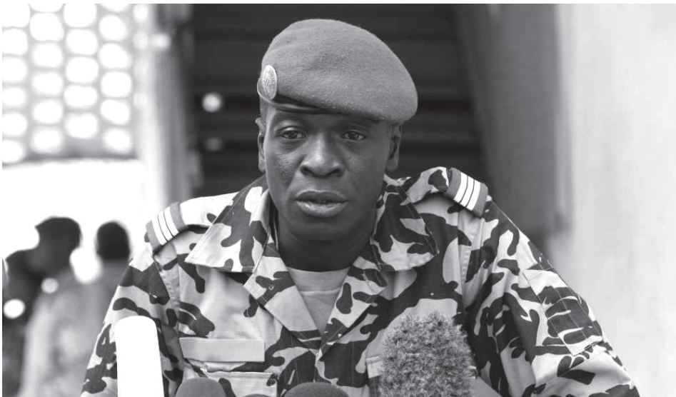
▲ Amadou Haya Sanogo.

Az Afrikai Unió felfüggesztette Mali tagságát, a Nyugat-Afrikai Államok Gazdasági Közössége 32 (CEDEAO-ECOWAS) szankciók bevezetését és nyugat-afrikai katonák bevetését helyezte kilátásba, az ENSZ BT a demokratikusan megválasztott elnöknek a hatalomba való visszahelyezését és az esedékes elnökválasztás megtartását sürgette, Franciaország felfüggesztette támogatási programját és ugyancsak az