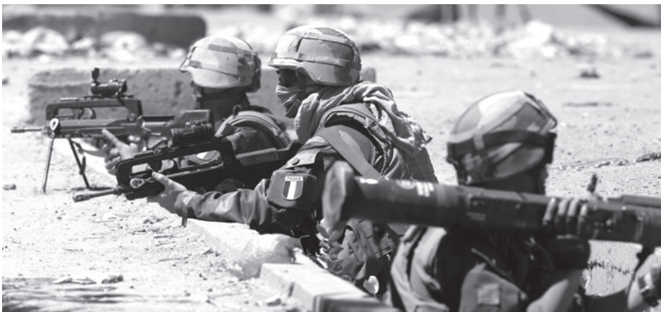
▲ Francia katonák Maliban.

Timbuktu, Gao, Kidal, tehát a nagy északi városok felszabadítása után a Serval hadműveleten belül megkezdődött a « Panthère IV » (Párduc IV) hadművelet, melyet francia és csádi katonák folytattak az algériai határhoz közel fekvő, két magyarországnyi területű, a menekülő iszlamistáknak menedéket nyújtó Ifogák hegységrendszerében. Ennek a február 18-án kezdődött hadműveletnek a célja az « iszlamisták felkutatása,