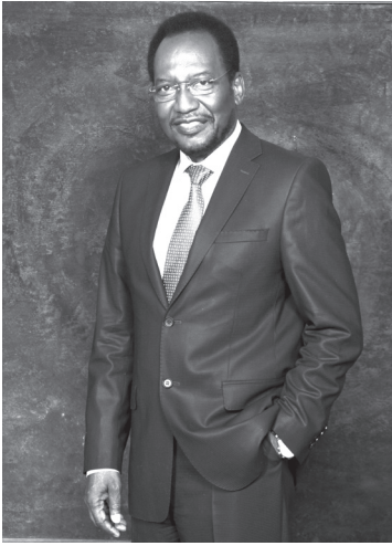
< Dioncounda Traoré