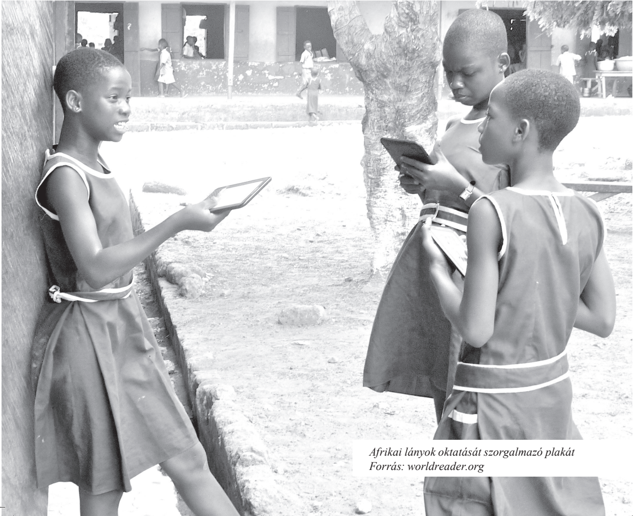
Afrikai lányok oktatását szorgalmazó plakát

A tanzániai alkotmány 2005-ös módosítása úgy fogalmaz, hogy a parlamentben helyet foglaló nők aránya nem lehet kevesebb harminc százaléknál. A nők helyeit pedig a parlamentbe bekerülő pártok között arányosan osztják szét (The Constitution of the United Republic of Tanzania, 1977: Part II. Article 66. 1/b.). Jelenleg a 350 képviselő közül 126 fő, ez 36 százalékos képviseletet jelent.