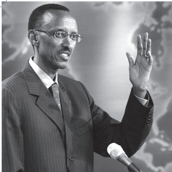
◀ Paul Kagame, Ruanda miniszterelnöke.