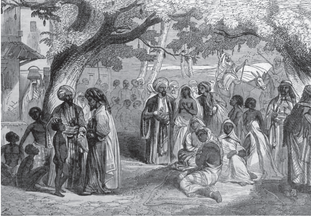
▲ A Moscat-i rabszolgapiacán nagy volt a kereslet az „emberi áru” iránt.