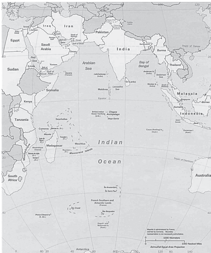
▲ Az Indiai-óceán politikai térképe (1993)

apparátus szükségét jelentette egészen az elmúlt évtizedekig (Vö.: Tarrósy–Morenth, 2013). Természetes tehát, hogy a hazai kutatók figyelmét elsősorban ezek megteremtése kötötte le az elmúlt évekig, illetve a „felzárkózás” a nemzetközi kutatásokhoz és trendekhez. Mivel ez utóbbit pedig elsősorban Kína előretörése Afrikában, és az ennek nyomán átalakuló nemzetközi kapcsolatok érdekelték, így más szereplők, főleg ha nem volt gyarmattartóról van szó, kevesebb hangsúlyt kaptak Magyarországon is. Elmondható ez – jelentős kivételektől eltekintve (Tarrósy, 2013) – Indiáról is. Míg azonban Kína rendszeres kapcsolata az afrikai kontinenssel lényegében – néhány legendás és homályos előzménytől eltekintve – a legtágabb értelemben véve is csak a 19. század végétől kezdett kialakulni, addig Dél-India az ókortól kezdve rendszeres, sőt szoros kapcsolatban állt Afrika keleti partvidékével. A kapcsolatokat