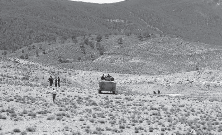
< A Chaambi hegység