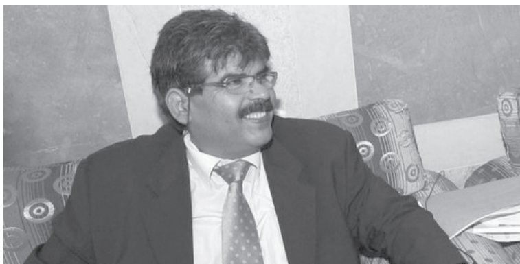
△ Mohamed Brahmī

lehetővé az iszlamistáknak, hogy a baloldalt pogánynak tekintsék. Márpedig az En-Nahda meg van arról győződve, hogy a jövőbe akkor lesz biztosítva, ha sikerül ezt a nagyon zavaró riválisát kiiktatni.” (jeuneafrique.com 2013.08.01.)