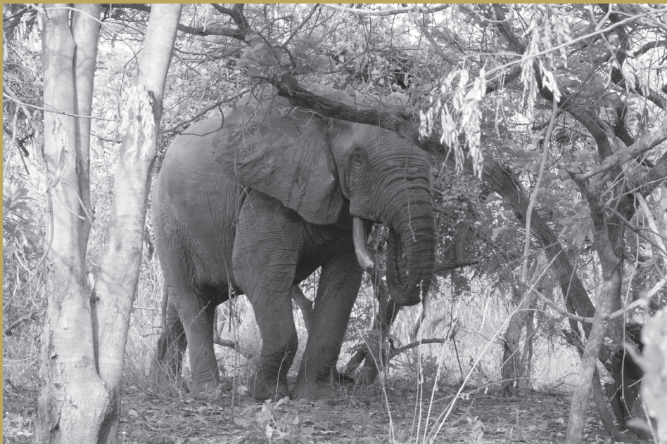
^ Valóra vált álom

Egy ismeretterjesztő csatornán láttam egyszer egy filmet arról, hogy egy árva kis-elefántot miként mentettek meg és neveltek két évig egy afrikai menhelyen. Ezek után menthetetlenül berögzült egy gondolat: bár ott lehetnék, bár átélhetném, bár láthatnám! Folyamatosan Afrikáról olvastam, könyveket, cikkeket, honlapokat. Egyre erősödött bennem az elhatározás, hogy el fogok jutni a fekete kontinensre! 8 hónappal később, mikor itthon még mindenki télikabátot hordott, megérkeztem Ghánába. Ahogy kiléptem a repülőgépből megérintett a forró, fülledt levegő, a pára és egy illat, amit itthon talán szagnak hívnék, de ott illat volt. Nem tudom semmihez sem hasonlítani, magamban azóta is Afrika illatának hívom.