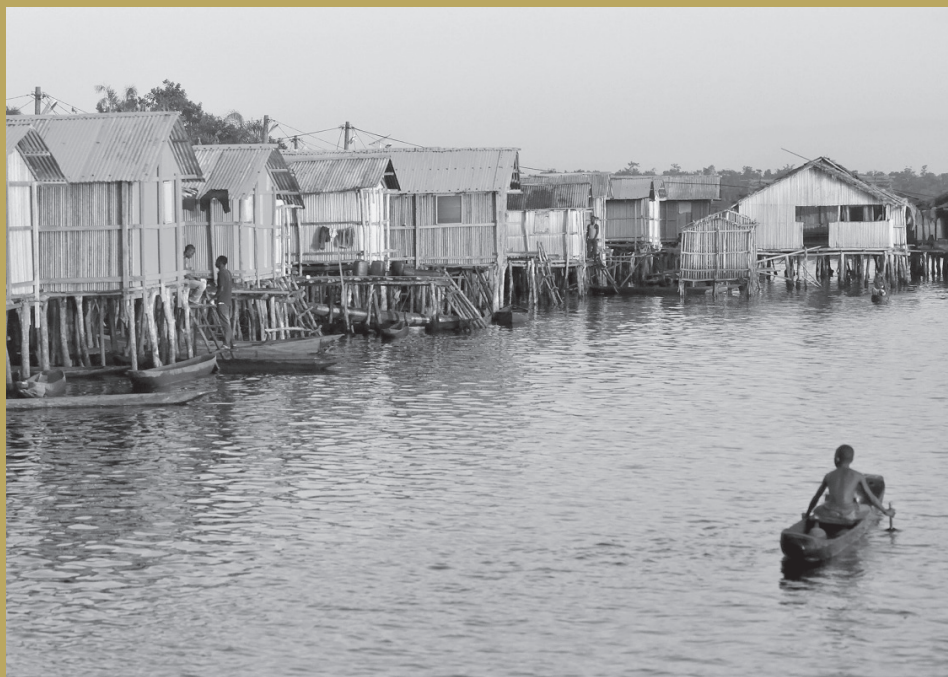
^ Nzulezo, Ghána.

természetes környezetében látni ezt a gyönyörű állatot. Délután kocsival jártuk be a parkot, viszont nagy bánatomra egyetlen elefántot sem láttunk, csak az itatóknál sereglettek, amire jó rálátás nyílt a hotelből. Szomorú voltam, mert másnap indultunk tovább és ez volt az utolsó lehetőség, hogy még egyszer találkozjam velük. Késő este, mikor mindenki elvonult a szobájába és már lefekvéshez készülődtem, egyszer csak hangos zajra, ágak zörgésére, léptekre lettem figyelmes. Egyre hangosabban hallottam a súlyos, komótos lépteket és a kíváncsiságom az ajtóhoz vitt. Résnyire nyitottam. 5 méterre az ajtómtól, velem szemben, teljes életnagyságban ott állt egy elefánt és engem nézett. „Látni akartál? Hát itt vagyok!” Ezek járhattak az elefánt fejében. Az enyémekben pedig az, hogy Te jó ég! Most itt van egy és engem néz. Rövid ideig néztük egymást, majd végigkóstolta a házikóink előtt lévő bokrokat és szép lassan eltűnt a sötétben. Alig tudtam elaludni akkor éjjel a boldogságtól. Afrika... Nekünk, európaiaknak e szó hallatán szegénység, nyomor, betegségek jutnak először eszünkbe. Nem így kellene lennie! Valóban más világ Afrika. De egy csodálatos világ a népeivel, melyek több figyelmet, törődést és elismerést érdemelnek. Még el sem hagytuk a kontinenst, máris honvágyat éreztem utána. Hasonlóan érzek azóta is, mint Hemingway: „Én nem akartam mást, csak visszajutni Afrikába”.