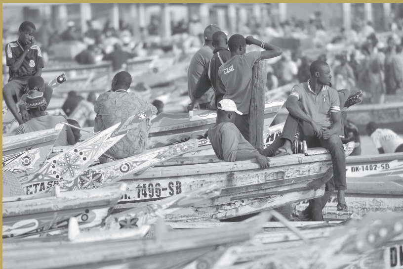
^ Színesre pingált halászcsonakok

Mbourban a kör alakú afrikai kunyhók mintájára épült hangulatos bungalókban szálltunk meg, az Atlanti-óceán partján. A parton jókat sétáltunk és óriás kagylókat és csigaházakat gyűjtöttünk. Egyszer séta közben a helyi halászok meghívtak bennünket teázni. A meghívást először ódzkodtunk elfogadni, de pár perccel később azon kaptam magam, hogy kerek szemmel lesem, hogyan főzik az édes teát. Közben