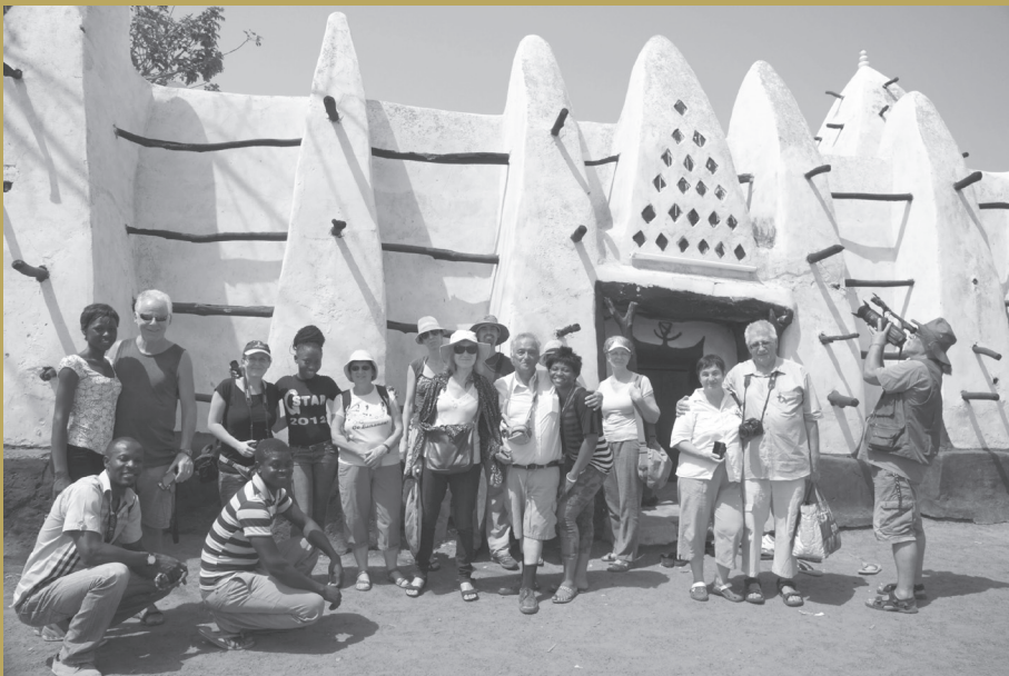
^ Larabanga mecset

- Nem értem...sajnálom – tettem hozzá, mikor harmadjára végre kihallottam a mondandóját: “Jó utat!” – mondta nekem és abban a pillanatban nem csak a tört angolsággal morzsolt szavait, hanem valami mást is megértettem. Elszégyelltem magam. Már megint legyőzött az előítélet. Végérvényesen elmulasztottam az elmúlt percekből ki tudja, mennyi mindent. Gyorsan felszálltam a buszra, leültem, és onnan kerestem meg az időközben kisebb sereggé duzzadt kísérők között az én kis követőmet. Magamra mért penitenciaként még integettem is neki, minden bizonnyal csak ennyi figyelmességet remélt volna tőlem az én kis pimasz kölykőm. Azóta is sokszor eszembe jutott ez a jelenet. Már csak ezért is érdemes volt elutaznom Ghánába.