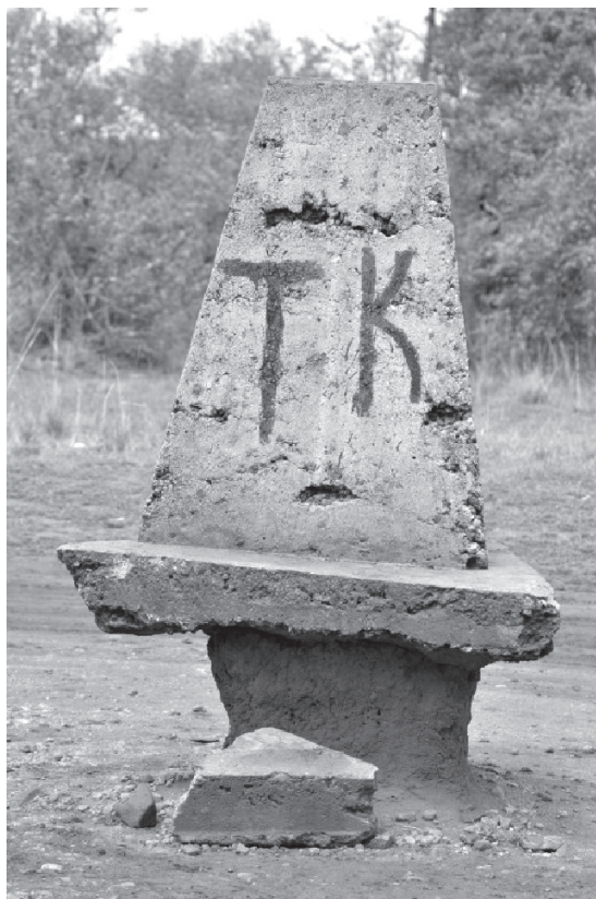
< A határkő a kenyai-tanzániai határon.