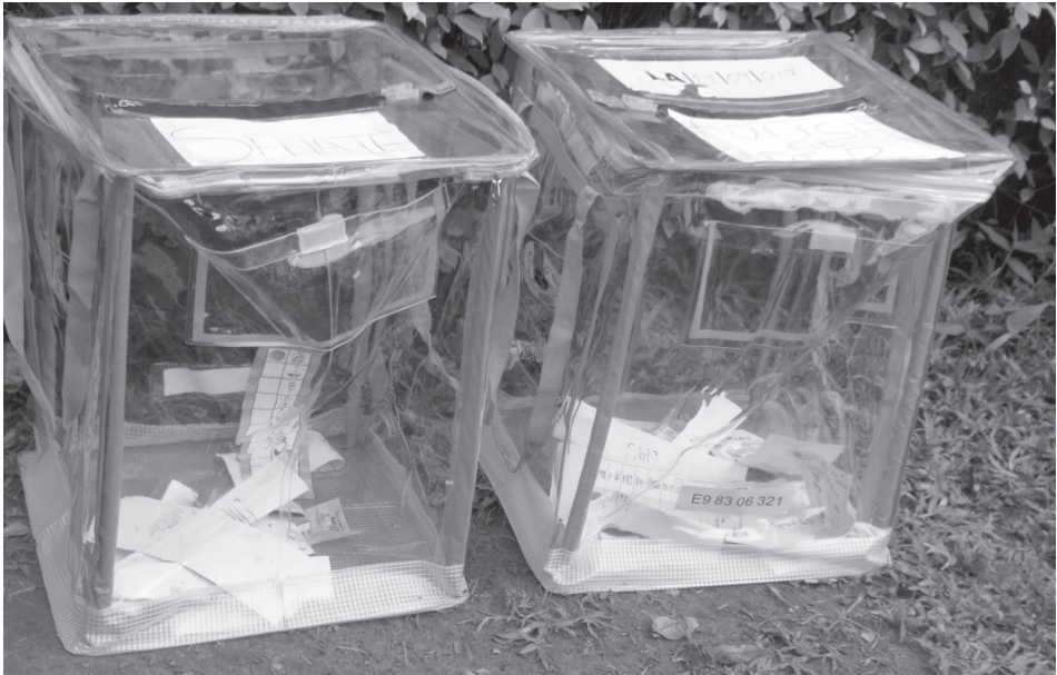
▲ Választási urnák.

A választások pontos megtartása már csak azért is lenne fontos, mert a terrortámadások mindennapossá váltak, egy sikeres választás pedig nem csupán a politikai elit legitimitációját növelné, hanem lehetőséget biztosítana a kormány számára, hogy a lakosságot fenyegető Boko Haram elleni fellépésre összehozza. A helyzetet ugyanakkor maguk a politikai pártok sem segítik: a domináns és az 1999-es demokratikus fordulat óta egyeduralgoló párt, a Népi Demokratikus Párt (People's Democratic Party, PDP) ugyanis saját íratlan szabályait is felrúgta már 2011-ben, és a helyzet a mostani választásokkal tovább eszkalálódhat. A párton belüli gentlemen's agreement ugyanis az volt, hogy a hatalom két ciklusonként felváltva oszlik meg a többnyire muszlim észak és a többnyire keresztény dél között. Ez a megállapodás 2010-ben került veszélybe, mikor az első ciklusát töltő, északi Umaru Yar'Adua hosszán tartó betegeskedést követően elhunyt és helyét helyettese, Jonathan Goodluck vette át. Már a 2011-es választások során is indulatokat keltett Goodluck indulása az elnöki tisztségért, tekintve, hogy „észak” csupán egy terminust kapott, de a déli származású elnök újbóli indulása még komolyabb indulatokat szabadíthat el az északiak részéről egy amúgy is érzékeny helyzetben. 7