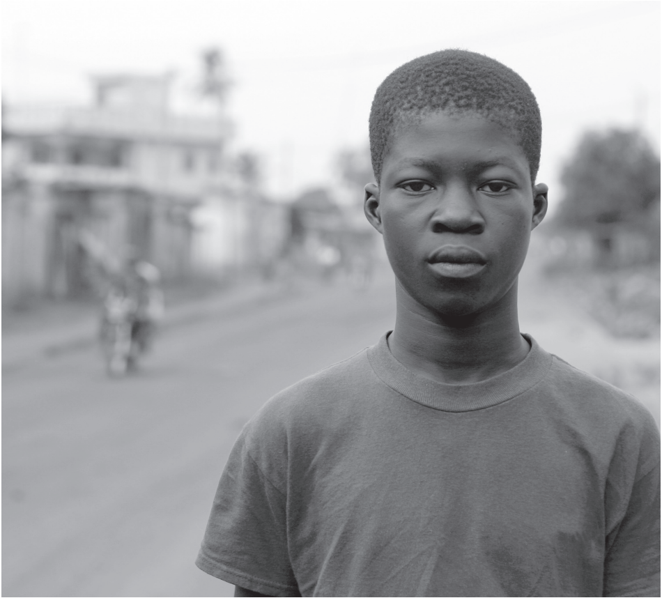
▲ Nigériai fiatal és a bizonytalan jövő.

ságot fog igényelni az új elnöktől a fiatal munkanélküliség visszaszorítása, mely csak akkor lehet sikeres, ha nem csupán az ifjúságpolitika oldaláról, hanem az oktatás- és képzés-politika, valamint a munkaerőpiaci feltételek javítása oldaláról együttesen, összetetten közelítik meg. A terrorizmus, a szélsőséges cselekmények visszaszorítása azonban nem egyedül Nigéria, hanem az egész térség és a nemzetközi közösség közös érdeke, és azért, hogy láthatóan Nigéria önmaga nem képes a megoldásra, további összefogást igényel. ☀