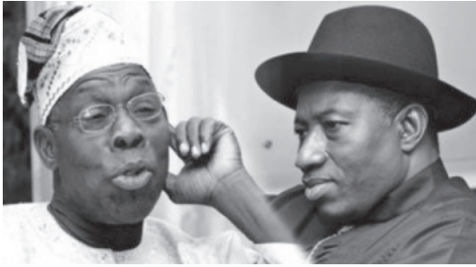
▲ Obasanjo kérdőre vonta Jonathant.

gozni, amely a két nagy vallási közösség jövőbeli békés egymás mellett élését képes lenne garantálni” (Uo: 70).