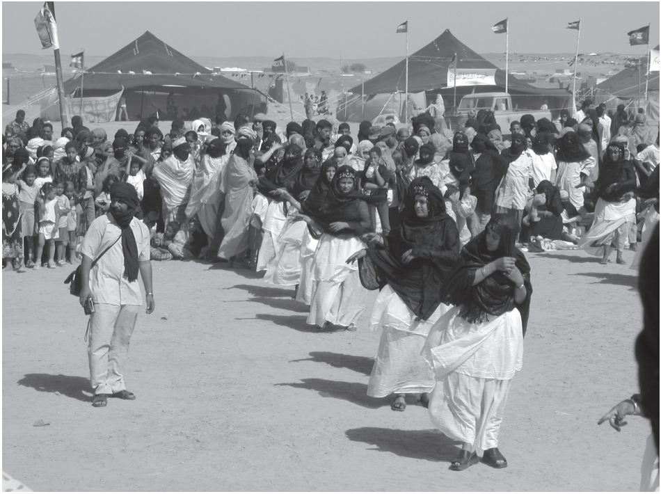
▲ Forrás: Besenyő János (2012): A nyugat-szaharai válság . Publikon Kiadó, Pécs.

Az emberi jogokat a jogtudomány három generációra szokta osztani. Nyugat-Szahara esetében egyelőre érdemes inkább csak az első tekintetében szólni, oda ugyanis azok a jogok tartoznak, amelyekért jelenleg még küzdenek az őslakosok. A másik két generáció (gazdasági, szociális és kulturális jogok, illetve a harmadik, még kevésbé meghatározott kategória) jogai csak a rendezés után kerülhetnek előtérbe.