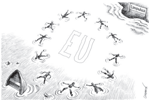
▲ Karikatúra az Unió migránsokat kezelő politikájáról.