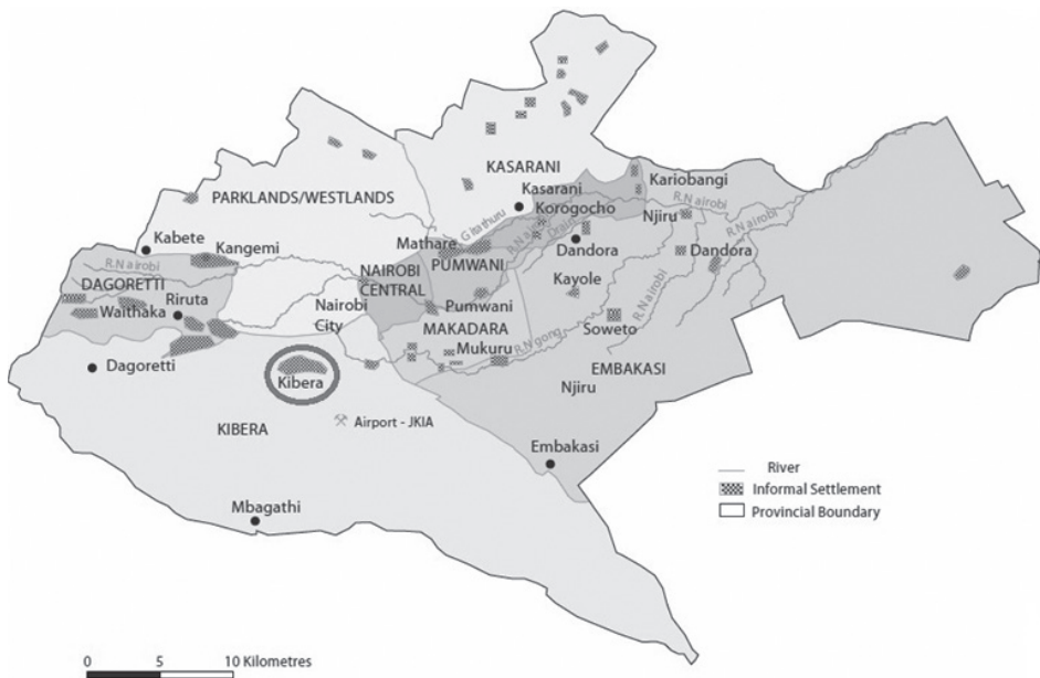
✓ 2. ábra: Kibera helyzete Nairobiban belül.

Kibera etnikai összetétele a függetlenedésig igen homogén volt, ám 1963 után Jomo Kenyatta elnök engedélyezte néhány kenyai betelepülését is, mely a núbiaiak felháborodását eredményezte. A politikai vezetés erre reagálva széles körben