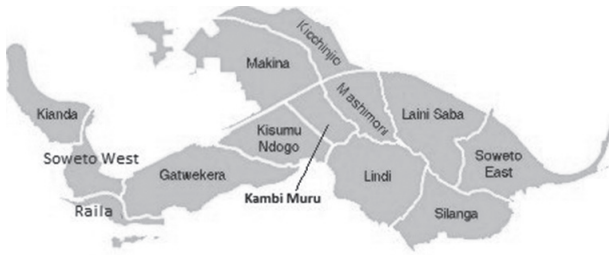
3. ábra: Kiberai village-ek területi elhelyezkedése.