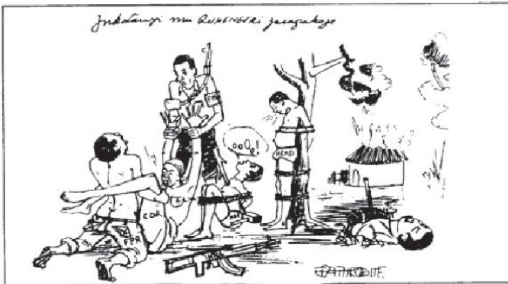
Le sang et le sexe. Les "horreurs de la guerre attribuées au FPR (Kamarampaka, 7. avril 1993, n° 15, p. 14)

- Les Inkotanyi ont travaillé à Ruhengeri.