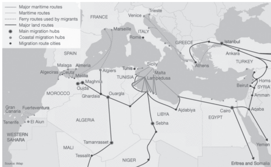
▲ Útirány: Európa.

Mára azonban Spanyolország kevésbé vonzó desztináció a migránsok számára, mivel a gazdasági világválság miatt nagymértékben nőtt a spanyol munkanélküliek száma, akik a korábban a bevándorlóknak fenntartott kevésbé kívánatos munkákat is hajlandóak elvállalni, így az illegális bevándorlók lehetőségei még inkább csök-