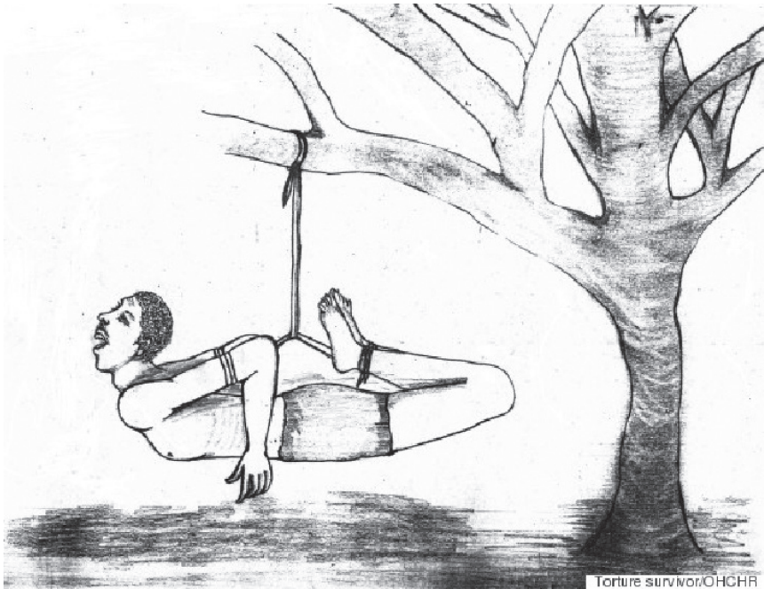
2-3. ábra: Eritreai menekült rajzai a „kiképzőtáborokban” zajló rendszeres kínzásokról. Forrás: Alfred, Charlotte: „A Torture Survivor Drew These Pictures to Describe Hell Eritrea Has Become”. The Huffington Post , 2015. november 6.