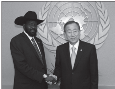
Salva Kiir és Ban Ki Mun.

A déli kormány, az egyház és a civil szervezetek számára a legnehezebb feladat a nép túl magas elvárásainak helyes kezelése lesz. A dél-szudániak évtizedek óta várnak erre a pillanatra. Legtöbben úgy