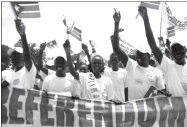
Megmozdulás a referendumért.

Szudán olajexportáló ország, napi kb. 500 ezer hordó kitermeléssel. A jelentős mennyiségű ismert olajkészlet (6.3 billió hordó) csaknem 75%-a Dél-Szudán területén található. Kartúm bevételének mintegy 60%-a az olajexportból származik.