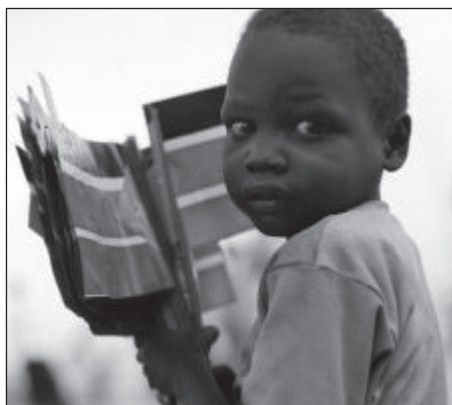
Jubai kisfiú zászlókat tart.

Az ENSZ, az USA és Juba szövet- ségesei a referendum időben való meg- tartása mellett is lándzsát törnek, hiszen Peter Adwok Nyaba, a szudáni felsőok- tatási és kutatási miniszter nyilatkozata szerint a referendum elhalasztása veszé- lyesebb a háborúnál.